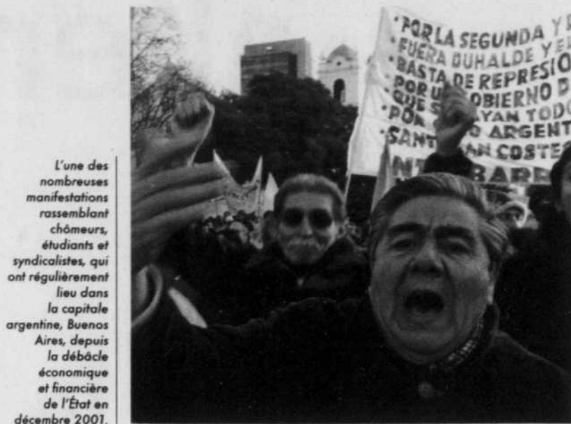
L'une des nombreuses manifestations rassemblant chômeurs, étudiants et syndicalistes, qui ont régulièrement lieu dans la capitale argentine, Buenos Aires, depuis la débâcle économique et financière de l'État en décembre 2001.

Durant les trois ans de gestion ouvrière, les travailleurs de Zanon ont été à maintes reprises menacés par ordre d'expulsion. En 2004, le gouvernement de la province de Neuquén les a défaits une nouvelle fois, en menaçant de déloger la fabrique et de retirer les équipements et la machinerie. Soudainement, les anciens propriétaires manifesteraient quelque intérêt à récupérer leur entreprise.