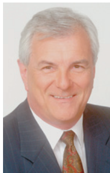
Dear Fellow Citizens,