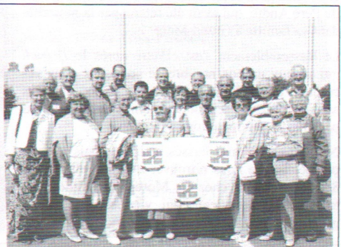
Notre drapeau a flotté sur les Trois-Pistoles