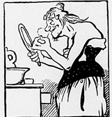
Une actrice du Français. Croquis par un artiste de Hull qui a risqué un oeil par le trou de la serrure au moment où cette artiste procédait à son maquillage.