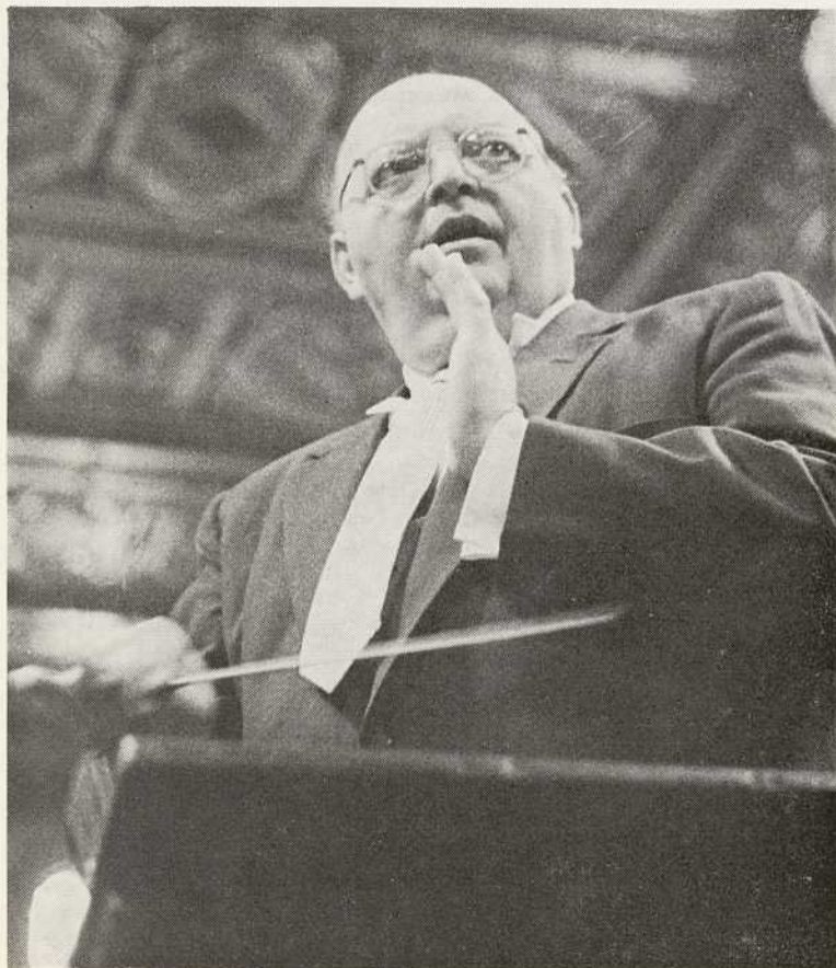
Joseph Krips — Chef d'orchestre / Conductor

"Brahms is in marvellous spirits, very pleased with his summer vacation and has – at least in his mind – completed a new symphony in D major. He has already written the first part", wrote Clara Schumann in the summer of 1877 to Munich. Brahms had spent his summer in Pörtschach, at the Wörther See, and it could be that the lyrical landscape had been his inspiration since his second symphony resembles a pastorale. Although this idyllic atmosphere pertained all through the Second Symphony, it would be wrong to assume that there is also a relaxed form of structure. On the contrary, Brahms has so well defined his guiding theme, developed his sub-themes so clearly from the main theme, and has achieved such strong unity in all four parts of the symphony, that this work could be presented as the convincing example of a perfectly completed symphonic masterpiece. In the same year of its creation, on December 30th, 1877, the Second Symphony by Brahms was presented by the Vienna Philharmonic Orchestra, under the direction of Hans Richter.