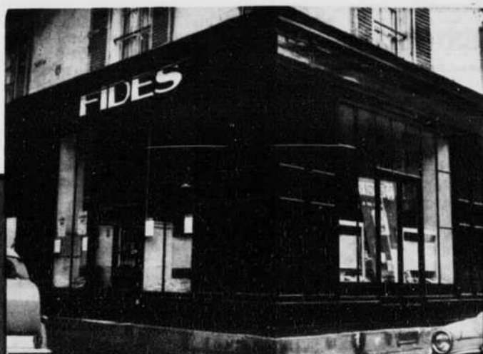
Ci-dessus le local de Fides Paris, au 3 rue Pélissier.

évoque ce qui reste à faire et l'on pourrait éprouver quelque inquiétude si précisément ce passé n'était