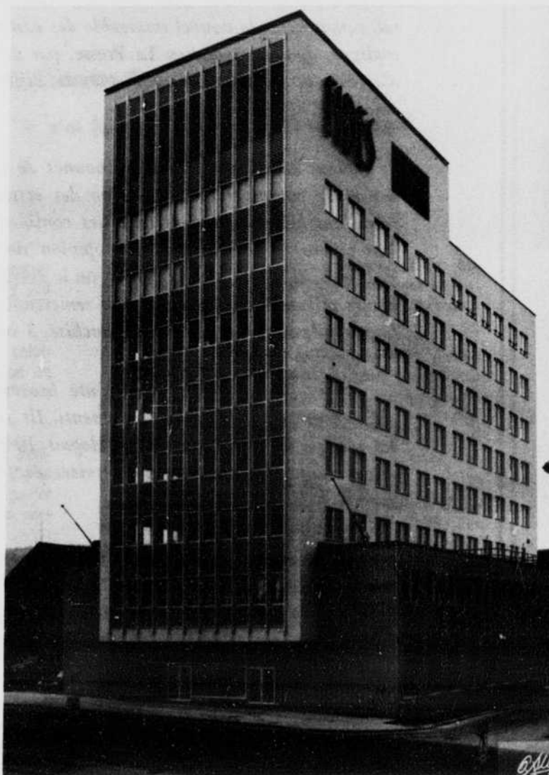
L'immeuble Fides, boul. Dorchester