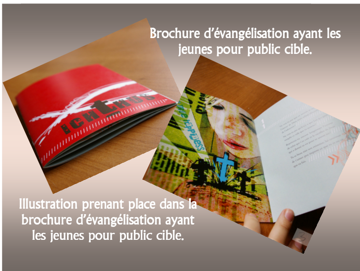
Brochure d'évangélisation ayant les jeunes pour public cible.