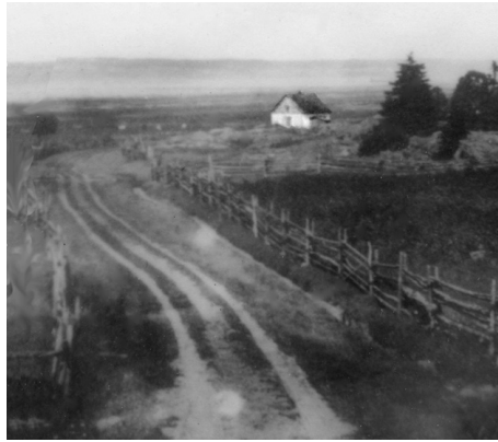
Dans les années 1930, les élèves de Rivière-des-Vases empruntaient un chemin parfois difficilement praticable pour se rendre à l'école n° 4.

Chaque écolier devait acheter ses livres, ses cahiers et amener son encrier et ses plumes. Les livres de lecture étaient fournis par la Commission scolaire de Cacouna. Pour se procurer des articles comme une ardoise (0.05 $) ou des crayons de pierre (craie) (0.04 $), certains enfants demeurant en bordure du fleuve allaient ramasser sur les battures des myes (coquillages) qu'ils vendaient. Ils se procuraient ces articles chez les marchands généraux ou chez le secrétaire de la Commission scolaire. Certains en achetaient de seconde main. Dans les familles nombreuses, on se les passait des plus vieux aux plus jeunes 15 .