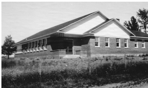
Le Collège Saint-Georges, vers 1952. Photographie tirée de l'exposition «Les Grandes Retrouvailles», Cacouna, 2000