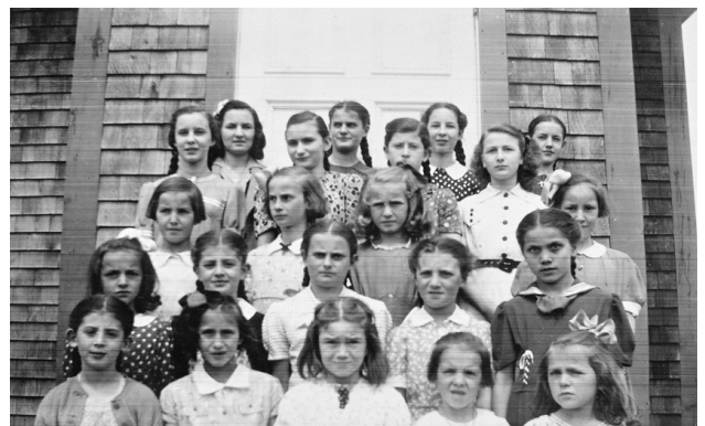
En 1943, l'école n° 5, située à l'intersection des chemins au deuxième rang, accueillait les enfants des familles Mailloux, Dumont, Bérubé, Chouinard, Perreault, Couillard et Guérette dans la classe de Berthe Soucy.

arrêtaient l'école avant de compléter leur septième année 13 .