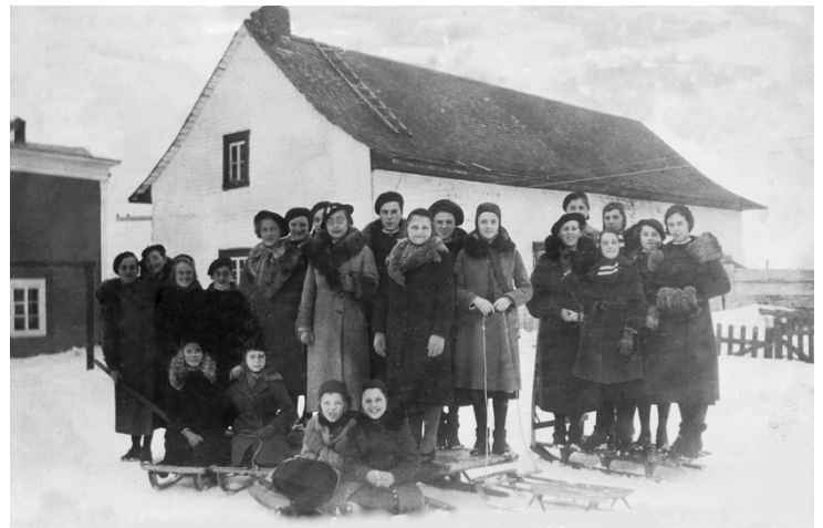
En 1940, les pensionnaires profitent de la glissade dans la cour du couvent.

En 1965, les révérendes sœurs du couvent, après avoir formé plusieurs générations de mères de familles, d'institutrices et de religieuses, ont fermé le pensionnat de jeunes filles qui était plus que centenaire. Deux ans plus tard, le bâtiment d'enseignement passa sous la direction de la Commission scolaire de Rivière-du-Loup. En 1983, le vieux couvent est démoli pour faire place à l'école primaire Vents-et-Marées.