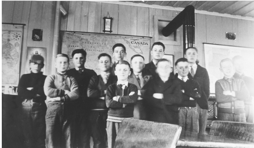
Dans la classe de l'école modèle, le professeur avait fixé sur les murs des cartes géographiques, des images du Sacré-Cœur de Jésus et un crucifix au-dessus du tableau noir.

Deux fois par an, un inspecteur vérifiait l'avancement des élèves et s'assurait que le programme avait été bien suivi. En 1871, l'inspecteur Georges Tanguay mentionnait dans son rapport qu'à Cacouna on compte un couvent, une école modèle et sept écoles élémentaires. Le couvent des révérentes dames de la Charité donne l'instruction à 105 élèves et fournit un grand nombre de