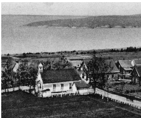
Entre 1838 et 1952, la cloche de l'école modèle a invité les écoliers à venir en classe.