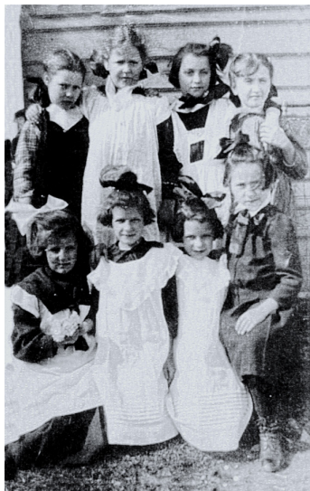
Vers 1910, des jeunes filles prennent la pose dans la cour du couvent.

La discipline était de mise dans cet établissement. Certaines se rappellent encore qu'elle était sévère et rigide. Les pensionnaires suivaient un horaire rigoureux qui incluait des heures pour la prière, l'office religieux, les repas, les études, les devoirs, les petites tâches ménagères et les récréations 24 . Lors de certaines occasions spéciales, les étudiantes présentaient des monologues, des petits sketches et des chansons sur la scène de la grande salle d'étude. Il y avait place aussi aux congés lors des différentes fêtes religieuses de l'année 25 .