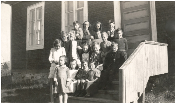
En 1951, les enfants des familles Soucy, Plourde, D'Amours, Côté devant l'école n° 7, en haut du village.

Les jeunes apprenaient la prière, le catéchisme, la dictée, la grammaire, la composition, l'arithmétique, l'histoire du Canada, l'Histoire sainte, la géographie, la bienséance et l'hygiène.