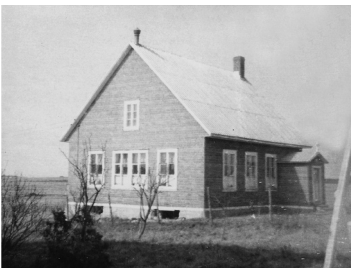
(HAUT) À partir de 1894, le Département de l'Instruction publique fournissait des plans pour la construction des maisons d'école. Au deuxième rang de Cacouna, on avait ajouté un clocheton sur le faîtière de la toiture de l'école n° 6.