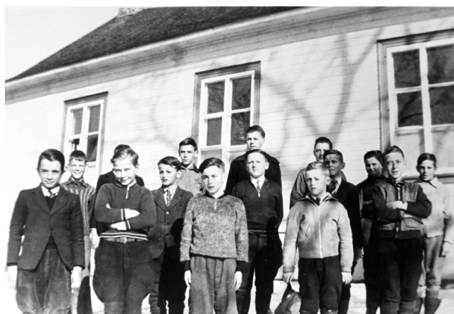
En 1945-46, les enfants des familles Beaulieu, D'Amours, Desjardins, Dionne, Ducas, Lavoie, Lebel, Létourneau, Marquis, Morneau, Ouellet, Perron, Rivard, Roy, Saindon, Thibault et autres profitent de la récréation dans la cour de l'école du village. Photographie tirée de l'exposition « Les Grandes Retrouvailles » Cacouna, 2000