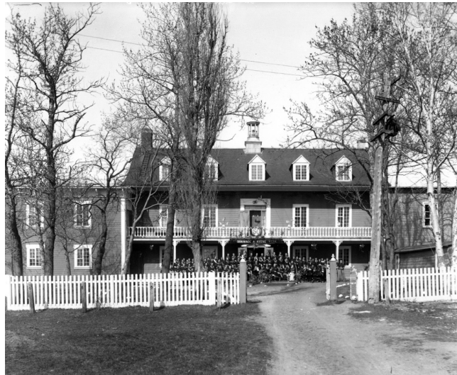
En 1907, la congrégation des Sœurs de la Charité fête le cinquantième anniversaire de la fondation de leur couvent à Cacouna. Musée du Bas-Saint-Laurent, Fonds Belle-Lavoie, NAC bl0169

Certaines années, on comptait jusqu'à 105 élèves, dont une cinquantaine de