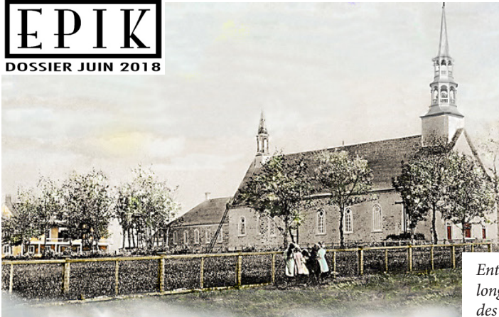
Entre 1857 et 1965, les jeunes filles de Cacouna empruntaient le chemin le long de l'église pour se rendre au couvent où elles recevaient l'enseignement des religieuses.