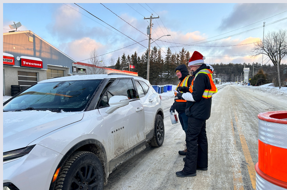
Les Témiscamiens se sont à nouveau montrés généreux lors de La guignolée des médias

La Guignolée des médias se poursuit jusqu'au 31 décembre, et il est encore possible de contribuer dans les commerces participants, en argent ou par chèque au bureau du Regroupement d'entraide sociale ou par virement Interac paniersdenoeltemiscamingue@gmail.com. Question: panier / Réponse : noel.