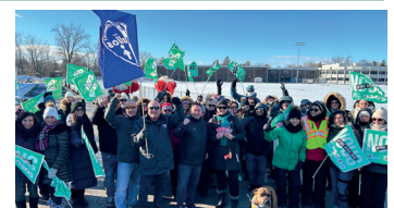
Dans les Laurentides