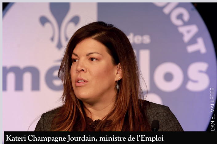
Kateri Champagne Jourdain, ministre de l'Emploi

Elle a insisté sur la présence des partenaires syndicaux dans les instances de concertation tels les comités sectoriels de main-d'œuvre