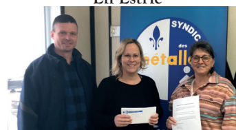
En Minganie sur la Côte-Nord