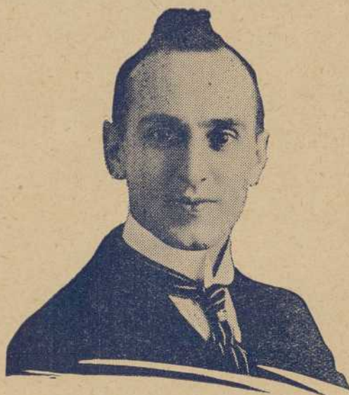
Le Chanteur Populaire