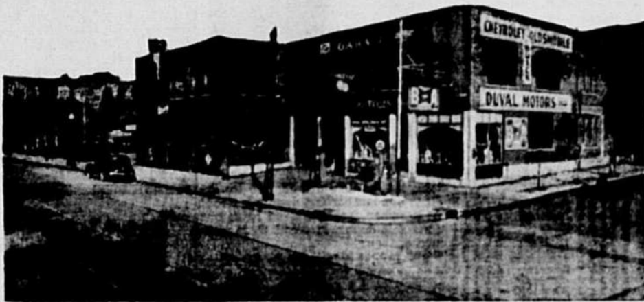
BUREAU-CHEF : 3930 EST, RUE SAINTE-CATHERINE

Un atelier spacieux, un outillage des plus modernes et des mécaniciens entraînés à la manufacture nous permettent de donner un service impeccable, rapide à des prix raisonnables.