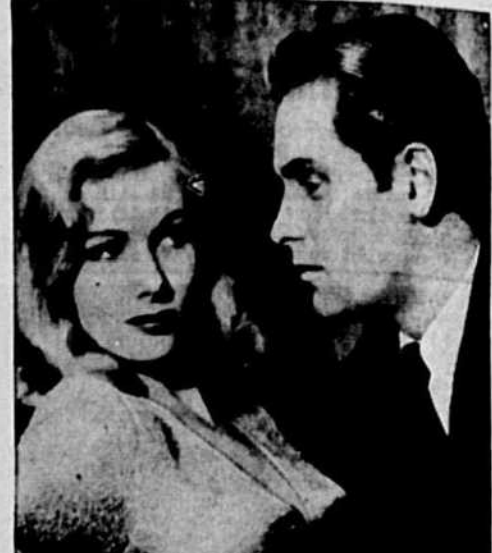
AU LOEW'S — Veronica Lake fait ses débuts au cinéma dans "I Wanted Wings". On la voit ici avec Ray Milland.