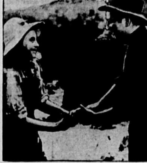
AU LOEW'S — Veronica Lake fait ses débuts au cinéma dans "I Wanted Wings". On la voit ici avec Ray Milland.