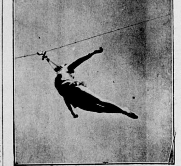
Mlle Bernice, acrobate de grande réputation, fera ses débuts demain au parc Belmont.