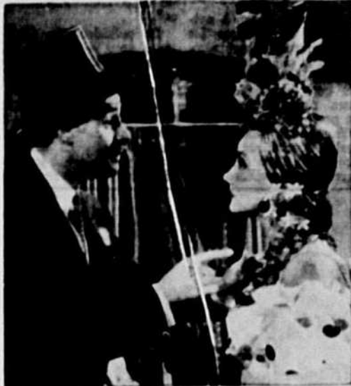
A L'IMPERIAL — Don Ameche et Carmen Miranda, vedettes du film "That Night in Rio", qui sera à l'affiche de l'Imperial, lundi.