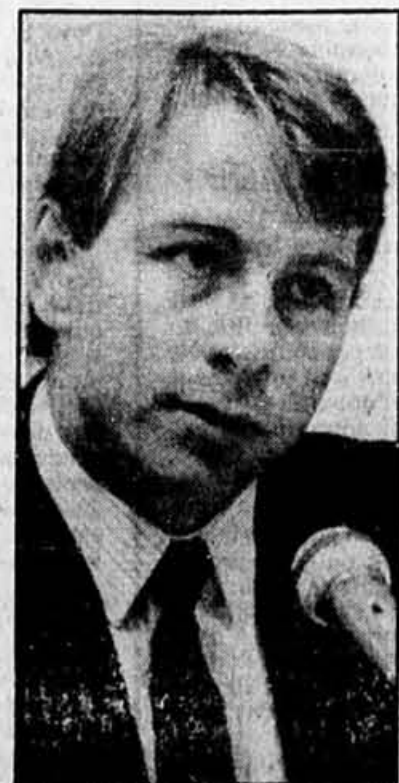
Alwyn Morris doit réorienter sa carrière.