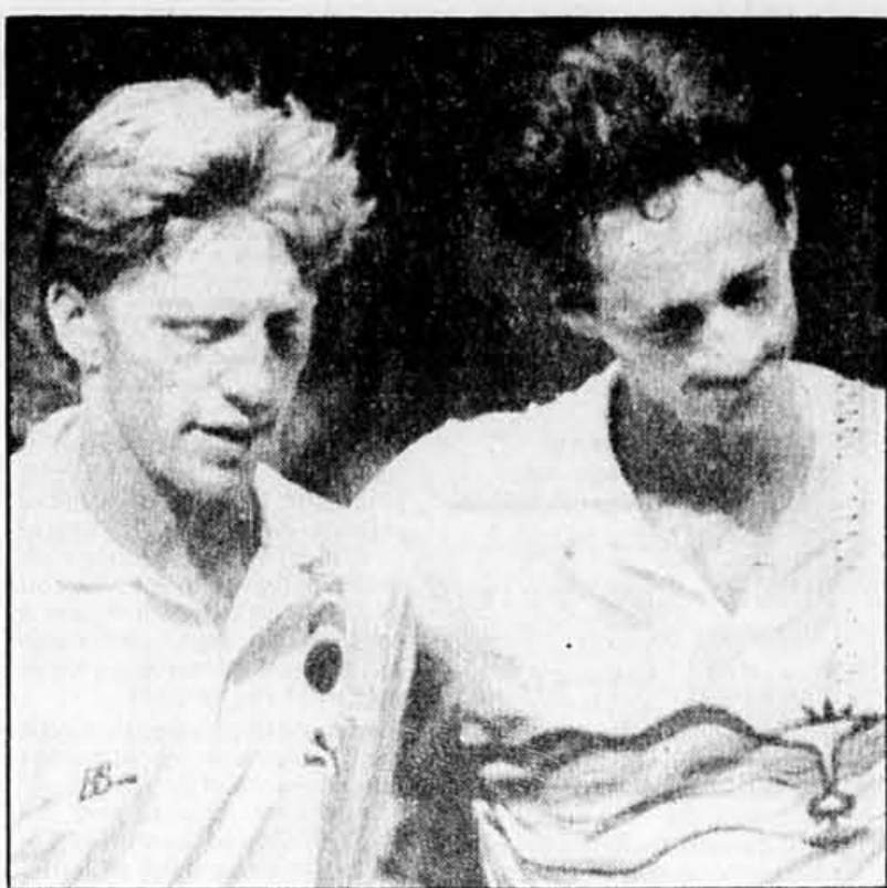
Des deux, Peter Dooohan semblait le plus déçu. Il venait pourtant de vaincre l'Allemand de l'Ouest Boris Becker, le champion déchu de Wimbledon. «Je n'ai pas encore bien réalisé que j'ai perdu le titre, a dit Becker. Demain, à mon réveil, je crois que je vais me sentir très mal.»

Trois autres têtes de série ont disparu. L'Australienne Wendy Turnbull (n. 12) a chuté devant l'Américaine Sharon Walsh-Pete. Les sœurs bulgares Katerina et Manuela Maleeva ont aussi connu la défaite.