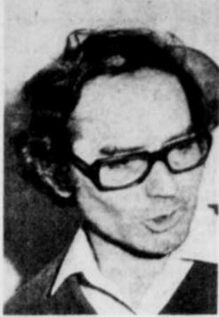
Adolfo Perez Esquivel

OSLO (AP) — Le Prix Nobel de la paix a été décerné lundi à Adolfo Perez Esquivel, sculpteur, architecte et humaniste argentin surnommé "le Gandhi con-