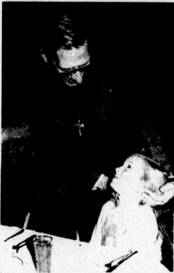
Quelques photos de Mgr. Adolphe Proulx Evêque du diocèse de Hull, discutant avec des enfants des familles de grévistes à l'usine Maclaren de Masson.