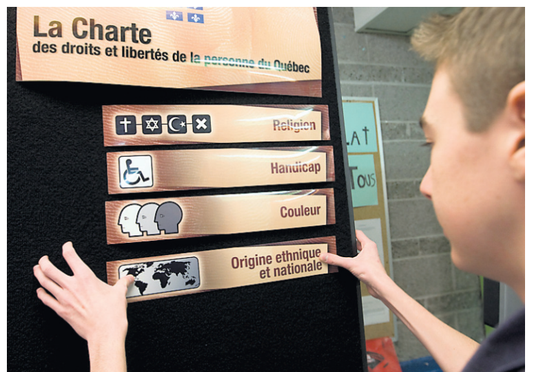
13 ans, à une époque de tension entre la majorité québécoise francophone et la communauté juive, qu'est née l'idée de la «caravane de la tolérance».