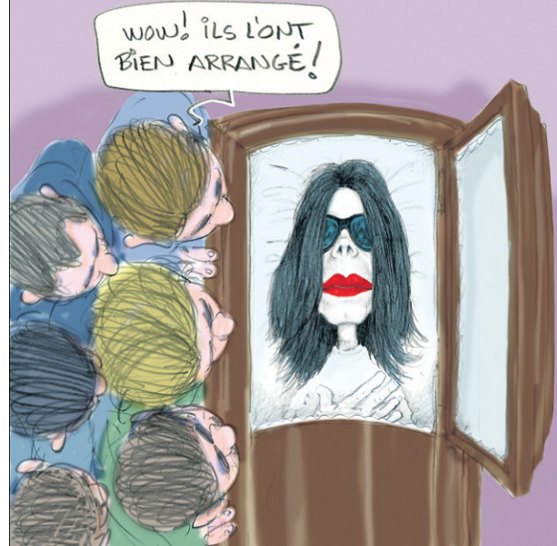
CARICATURES SERGE CHAPLEAU, LA PRESSE

SEULEMENT 2$ /MOIS POUR LES ABONNÉS VERSION PAPIER 2 SEMAINES D'ESSAI GRATUIT