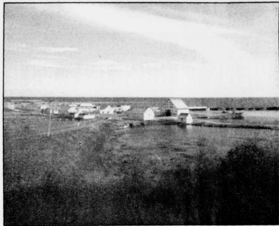
La municipalité de Paspébiac prévoit installer sur le banc un parc récréo-touristique avec hébergement.