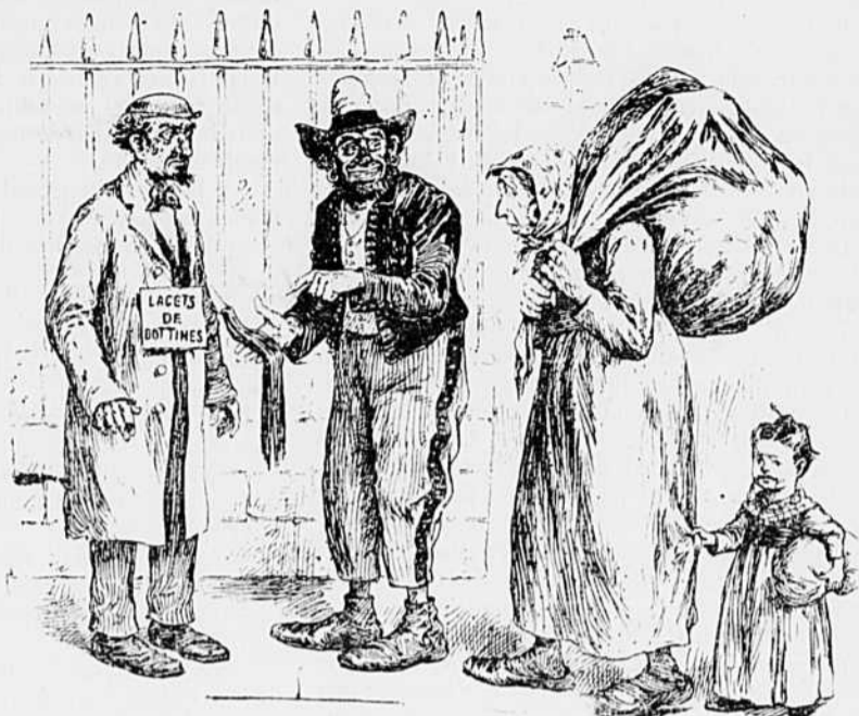
Italien nouvellement arrivé à Montréal : — Je crois, Béatrice, qu'il y a de l'argent à faire par ici, en leur montrant comment faire le macaroni blanc.

Patrick. — Bigre ! C'est une fameuse horloge. Comment marcherait-elle de temps si on la remontait ?