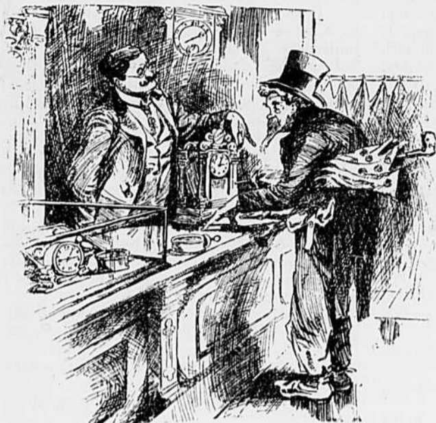
Le bijoutier. — Mon ami, cette horloge peut marcher huit jours sans être montée.

Patrick. — Bigre ! C'est une fameuse horloge. Comment marcherait-elle de temps si on la remontait ?