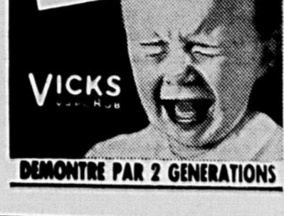
DEMONTRÉ PAR 2 GENERATIONS

Enrayée rapidement et une nuit reposante assurée