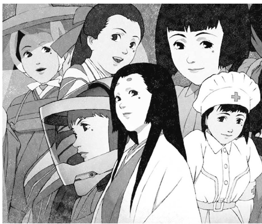
Millenium Actress devrait combler tout le monde, amateurs enthousiastes et simples curieux, et même à réconcilier ces derniers avec un art qu'ils associent peut-être encore à « du Goldorak pour adultes ».

Changeons subitement de registre : The Fucon Family est à des ères cosmiques de tout ce à quoi nous a habitués le Japon jusqu'à présent ; à des ères cosmiques de tout en général ! Divisée en huit épisodes minuscules (22 minutes en tout) cette série télévisée très populaire met en vedette non plus des acteurs ni même des bonhommes dessinés, mais bien des mannequins de centre commerciaux, de véritables pantins inanimés qu'on dirait sortis de chez Sears. Il s'agit ici d'une sorte de Papa a raison grotesque, revu et corrigé par des exégètes d'Andy Warhol et d'Eugène Ionesco : Les décors sont d'un kitsch extra-fromage, les situations et les dialogues semblent directement tirés d'un de ces manuels de savoir-vivre des années 50 ( L'Art de bien recevoir ou Un mariage réussi ) lu à l'envers. À côté, notre Petite Vie nationale ne paraît pas plus insolite