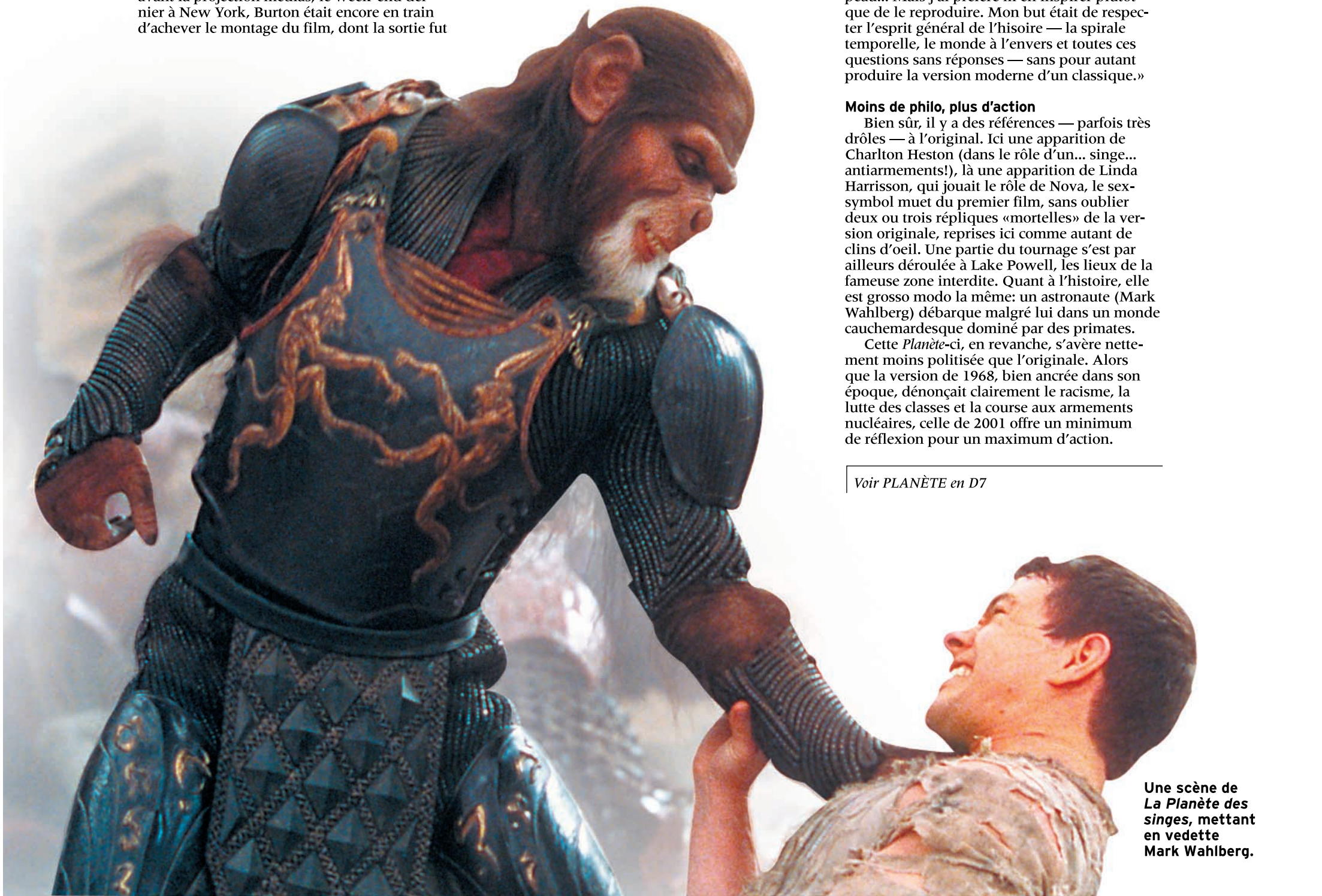
Une scène de La Planète des singes , mettant en vedette Mark Wahlberg.