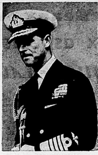
Quelle devise! le sympathique duc d'Edimbourg vient de se voir refuser le droit de voler. On ne sait jamais : un accident arrive si vite. Désormais il faudra demander l'autorisation à la reine avant de monter dans un "jet". Il s'est donc résigné à endosser définitivement l'uniforme de la Marine...