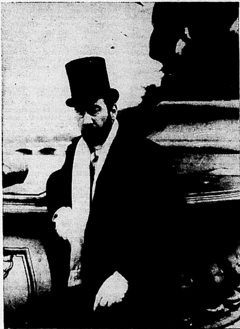
Toulouse-Lautrec, tel qu'il apparaît sous les traits de José Ferrer dans Moulin-Rouge .

Dans une certaine lithographie de Toulouse-Lautrec, on