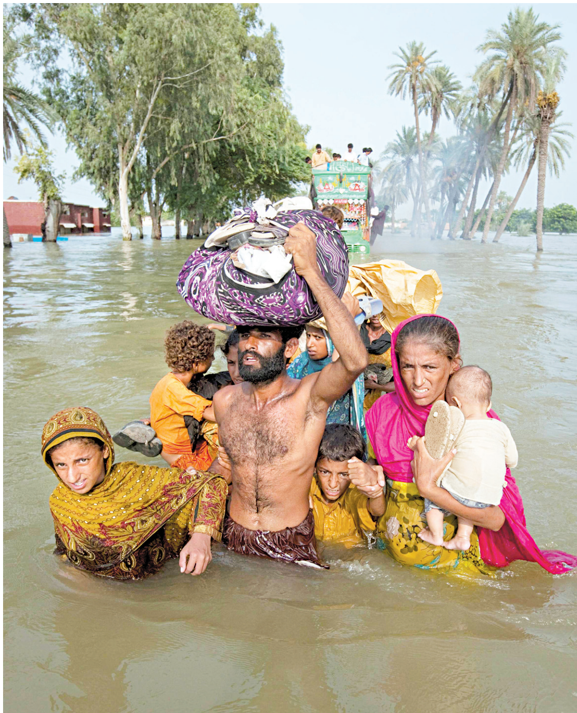
Une famille pakistanaise tentait hier de fuir les inondations.

Dimanche soir, des centaines de villageois ont brûlé des