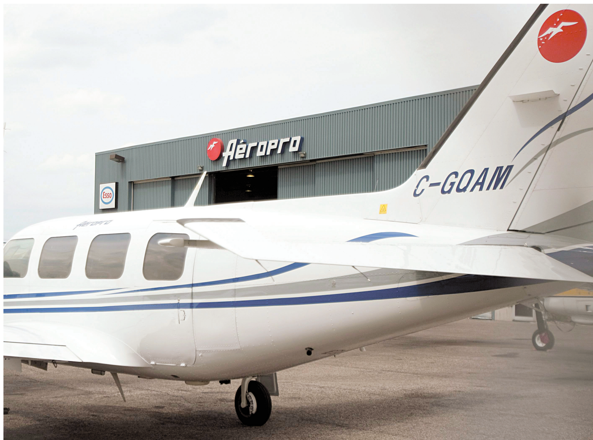
Un appareil de la firme Aéropro devant un hangar de l'entreprise, à Québec