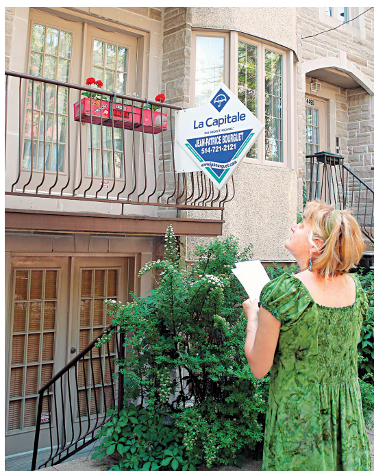
JACQUES GRENIER LE DEVOIR

Les ventes ont toutefois reculé lors de six des sept derniers mois, et elles ont chuté de 25 % rien que lors des trois premiers mois de l'année, donnant un peu plus de pouvoir aux acheteurs par rapport aux vendeurs, a observé Douglas Porter,