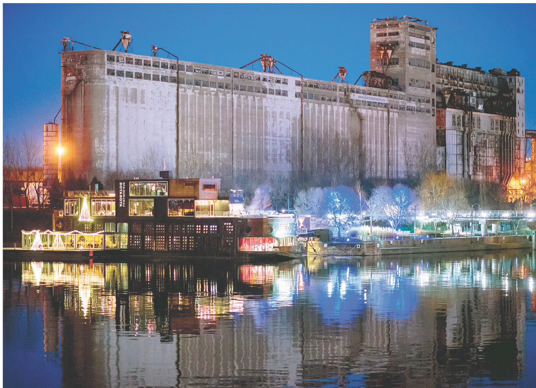
OLIVIER ZUIDA LE DEVOIR

Ainsi, s'est tenu, en 2010, un exercice de prospective, de «visioning [sic]» ayant mis à contribution plusieurs acteurs de la communauté montréalaise et permis de dégager cinq «piliers» d'une vision d'avenir. Un comité-conseil qui compte des représentants de groupes d'intérêt ou de la communauté touchés par le dossier a été mis sur pied pour accompagner la SIC dans l'opération. Les étapes de consultation sont bien balisées, la documenta-