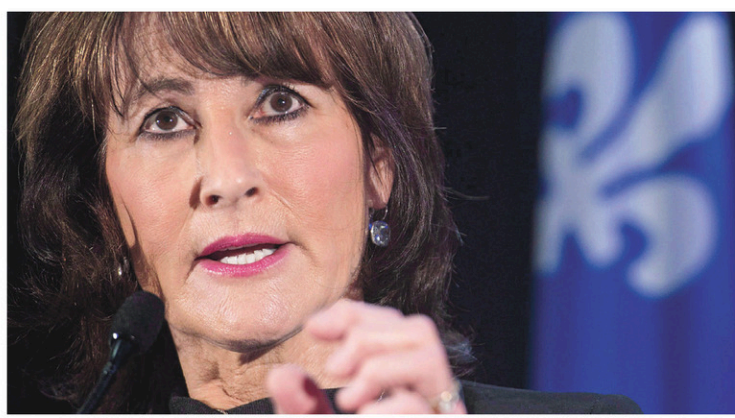
La ministre Kathleen Weil est intervenue personnellement pour que son ministère prenne les choses en main.