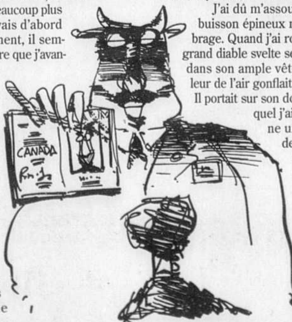
DESSIN BRUCE ROBERTS

J'ai dû m'assoupir un instant. Un buisson épineux me prêtait son ombre. Quand j'ai rouvert les yeux, un grand diable svelte se tenait devant moi dans son ample vêtement que la chaleur de l'air gonflait comme un ballon. Il portait sur son dos un fagot dans lequel j'ai reconnu sans peine une demi-douzaine de petits sapins plantés par les Agronomes canadiens. Visiblement curieux, il me haranguait à grands gestes dans sa langue. Pour le rassurer, j'ai eu l'idée de sortir mon passeport et de le lui