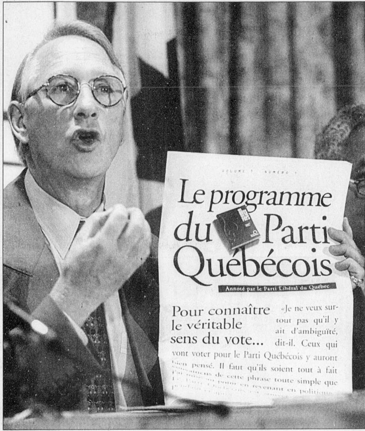
Le ministre Gérald Tremblay exhibe un exemplaire du programme du Parti québécois tel qu'annoté par le Parti libéral. Le PLQ reprend ainsi une tactique qui avait profité aux partisans du NON lors de la campagne référendaire sur l'accord de Charlottetown.