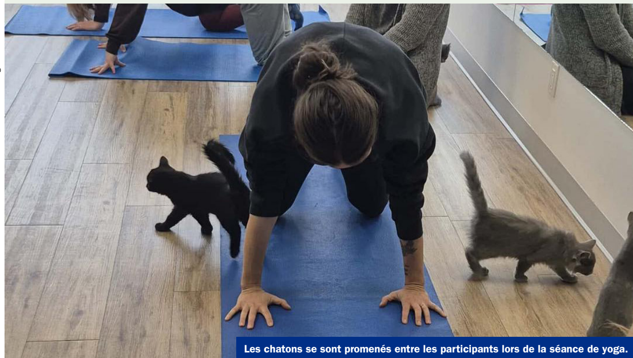
Les chatons se sont promenés entre les participants lors de la séance de yoga.

Le yoga-chatons s'est révélé être une occasion unique de prendre soin de soi tout en soutenant une bonne cause, et a offert aux petits pensionnaires du refuge une journée riche en rencontres, en tendresse et en câlins.