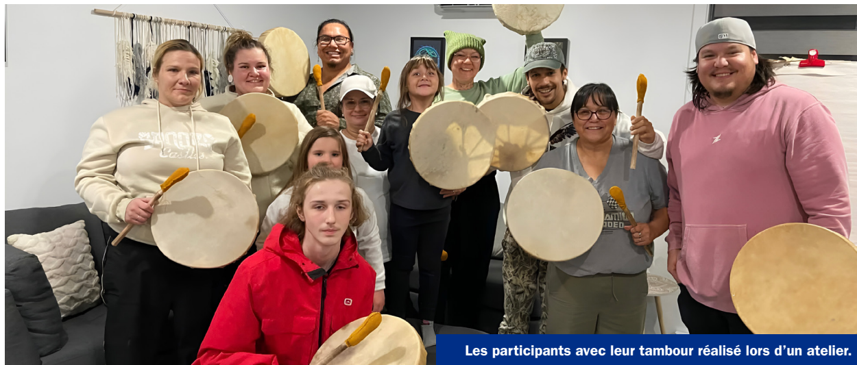
Les participants avec leur tambour réalisé lors d'un atelier.

La semaine a débuté par une cérémonie de purification smudge , un rituel traditionnel utilisant des plantes sacrées pour apaiser l'esprit et les émotions. Les participants ont ensuite pris part à un atelier de fabrication de tambours, symbole culturel fort, souvent décrit comme le battement du cœur de la Terre-Mère. Les activités se sont poursuivies avec un atelier de création de sacs médicinaux, contenant sauge, cèdre,