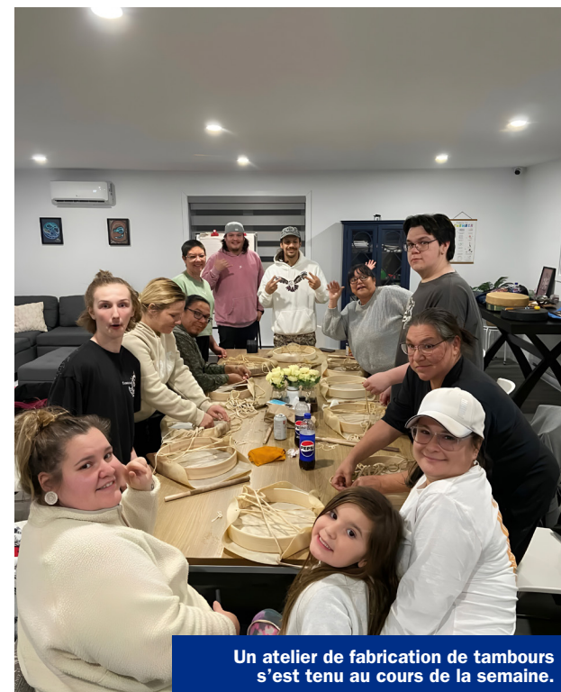
Un atelier de fabrication de tambours s'est tenu au cours de la semaine.