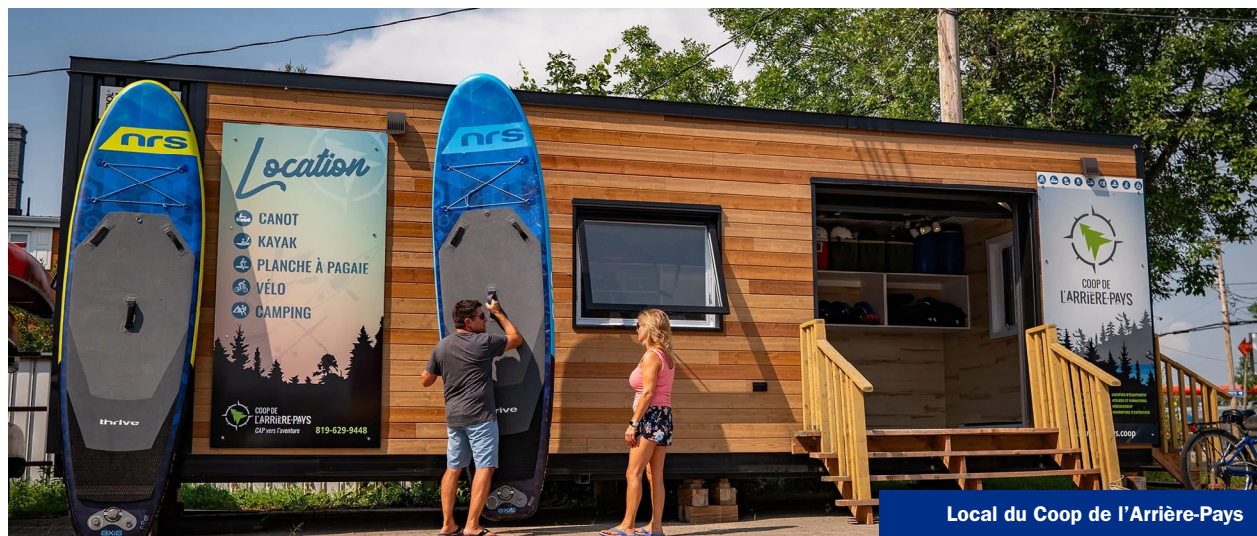
Local du Coop de l'Arrière-Pays

La coopérative a vu le jour grâce à un groupe d'experts et de passionnés, appuyés par les instances de développement du territoire, afin de combler des manques importants en matière d'équipement spécialisé, de services de navette et de transport de bagages, d'entretien des sites et surtout de personnel certifié en plein air.