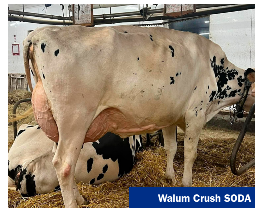
Walum Crush SODA