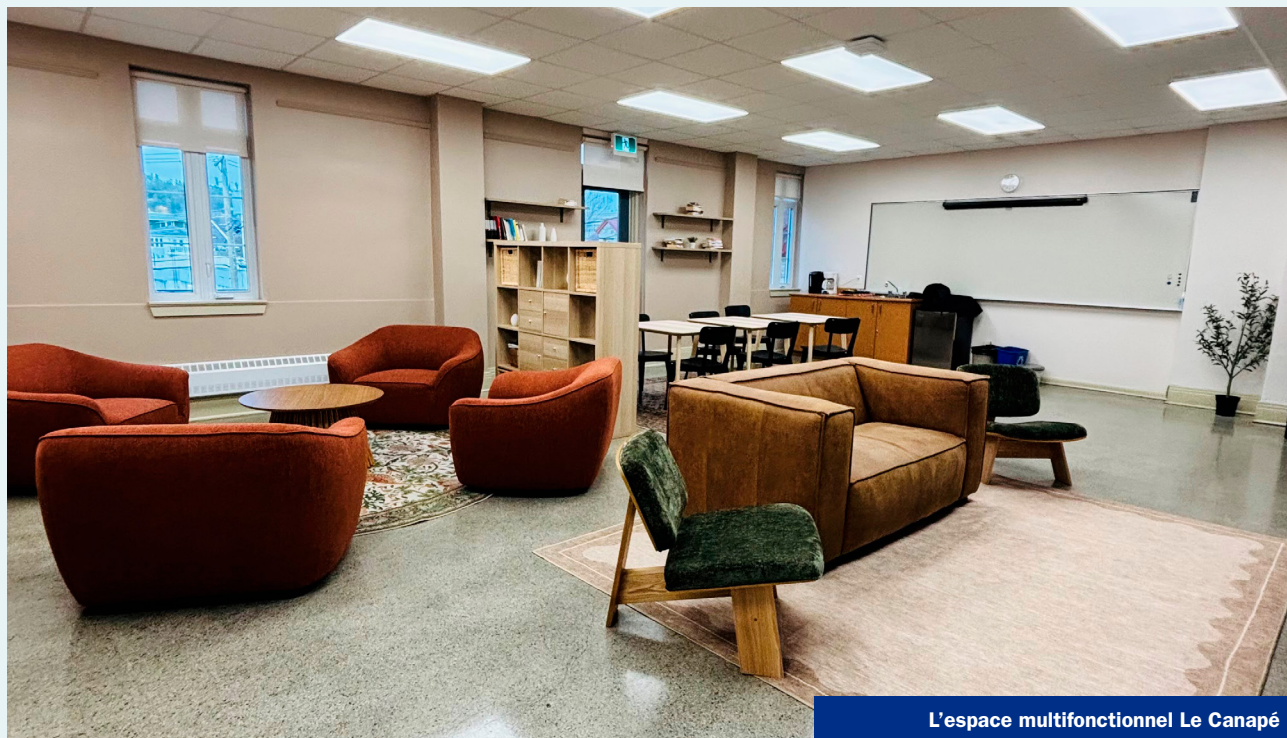
L'espace multifonctionnel Le Canapé

Le nom a été choisi à l'issue d'un concours étudiant, mettant en avant le canapé central et son esprit de convivialité. « Nous voulions offrir un lieu à l'image des élèves, où ils se sentent bien, motivés et valorisés », souligne Valérie Lalonde, agente de projet au CJET. Cet espace, déjà très apprécié, illustre l'importance du bien-être dans la réussite éducative et l'engagement collectif de tous les participants.