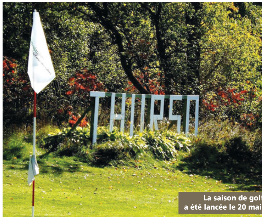
La saison de golf a été lancée le 20 mai.

l'arrivée des plus jeunes sur le terrain. « Ça m'encourage de voir ça. »