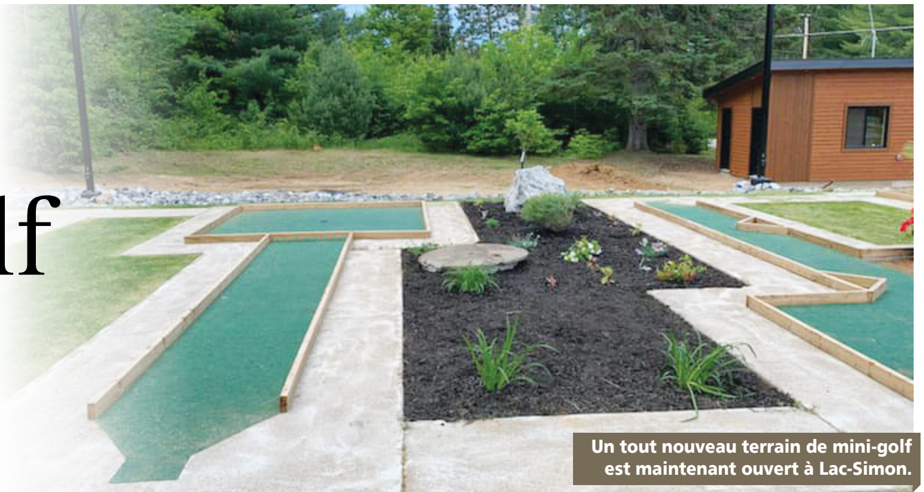
Un tout nouveau terrain de mini-golf est maintenant ouvert à Lac-Simon.

CLAUDIA Blais-Thompson claudia@journalles2vallees.ca