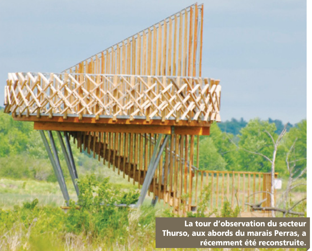
La tour d'observation du secteur Thurso, aux abords du marais Perras, a récemment été reconstruite.

La tour d'observation du secteur Thurso, aux abords du marais Perras, a récemment été reconstruite. Elle offre un point de vue sur le marais et la rivière des Outaouais. « Les architectes ont recréé un nid d'oiseau. Il y a aussi le bois qui monte et ça illustre une envolée d'oiseaux. »