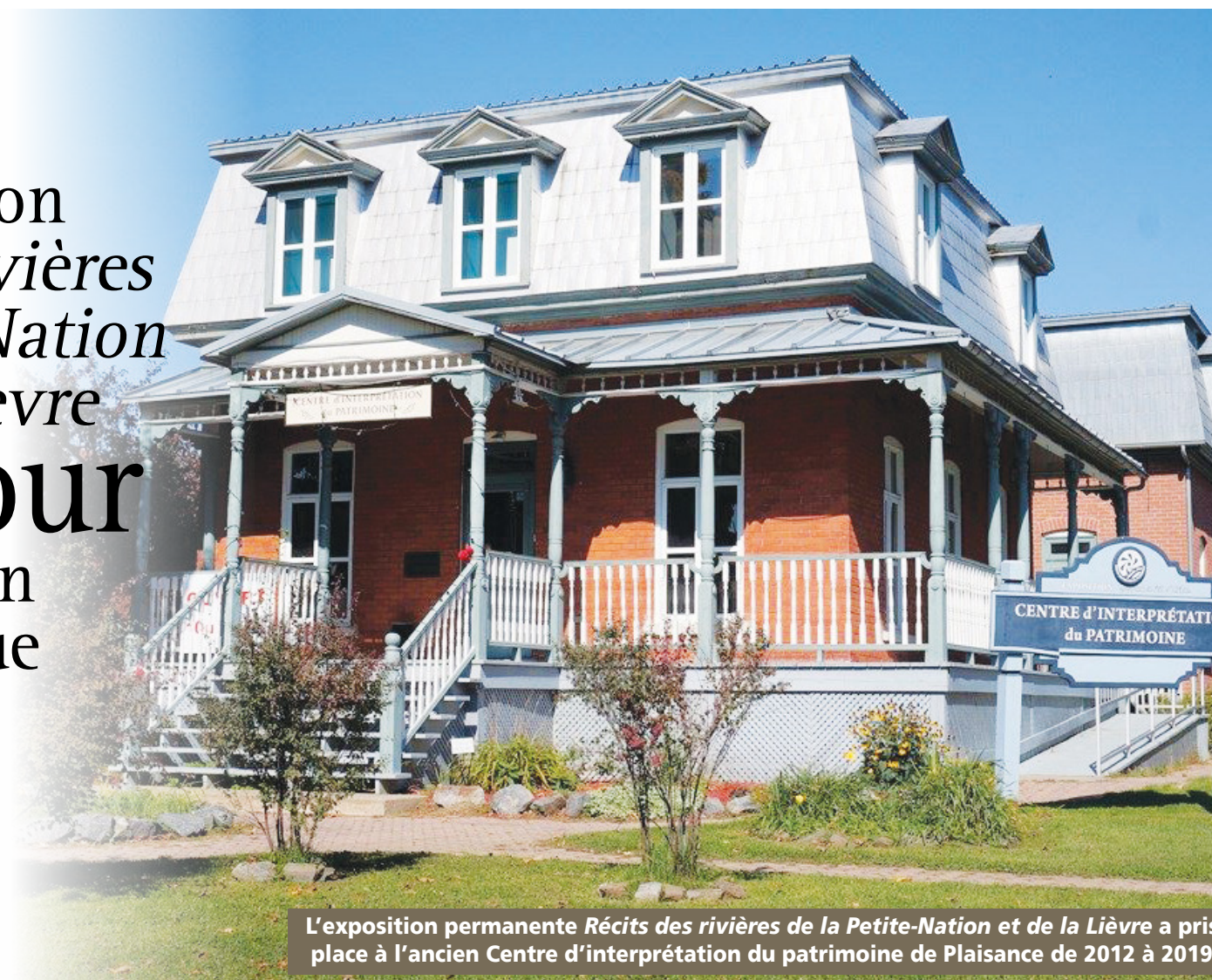
L'exposition permanente Récits des rivières de la Petite-Nation et de la Lièvre a pris place à l'ancien Centre d'interprétation du patrimoine de Plaisance de 2012 à 2019.

CLAUDIA Blais-Thompson claudia@journalles2vallees.ca