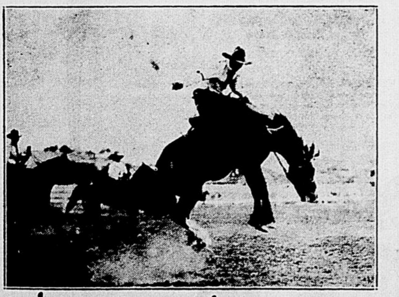
Le "Stampede" de Calgary, auquel assisteront cette année les voyageurs de l'Université de Montréal, à leur passage dans la métropole de l'Alberta le 10 juillet prochain, est un spectacle fort curieux pour ceux qui s'intéressent aux choses des plaines de l'Ouest. Cette grande foire, qui attire chaque année des milliers de spectateurs, met en vedette les meilleurs cavaliers du Canada et des Etats-Unis, qui étonnent les foules par leurs prouesses équestres sur chevaux indomptés.