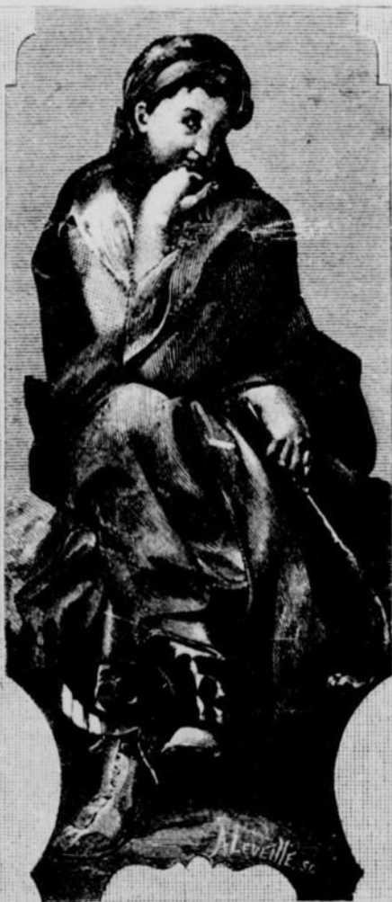
THALIE (La Comédie)