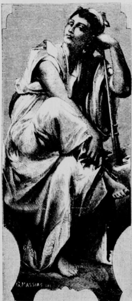
EUTERPE (La Musique)