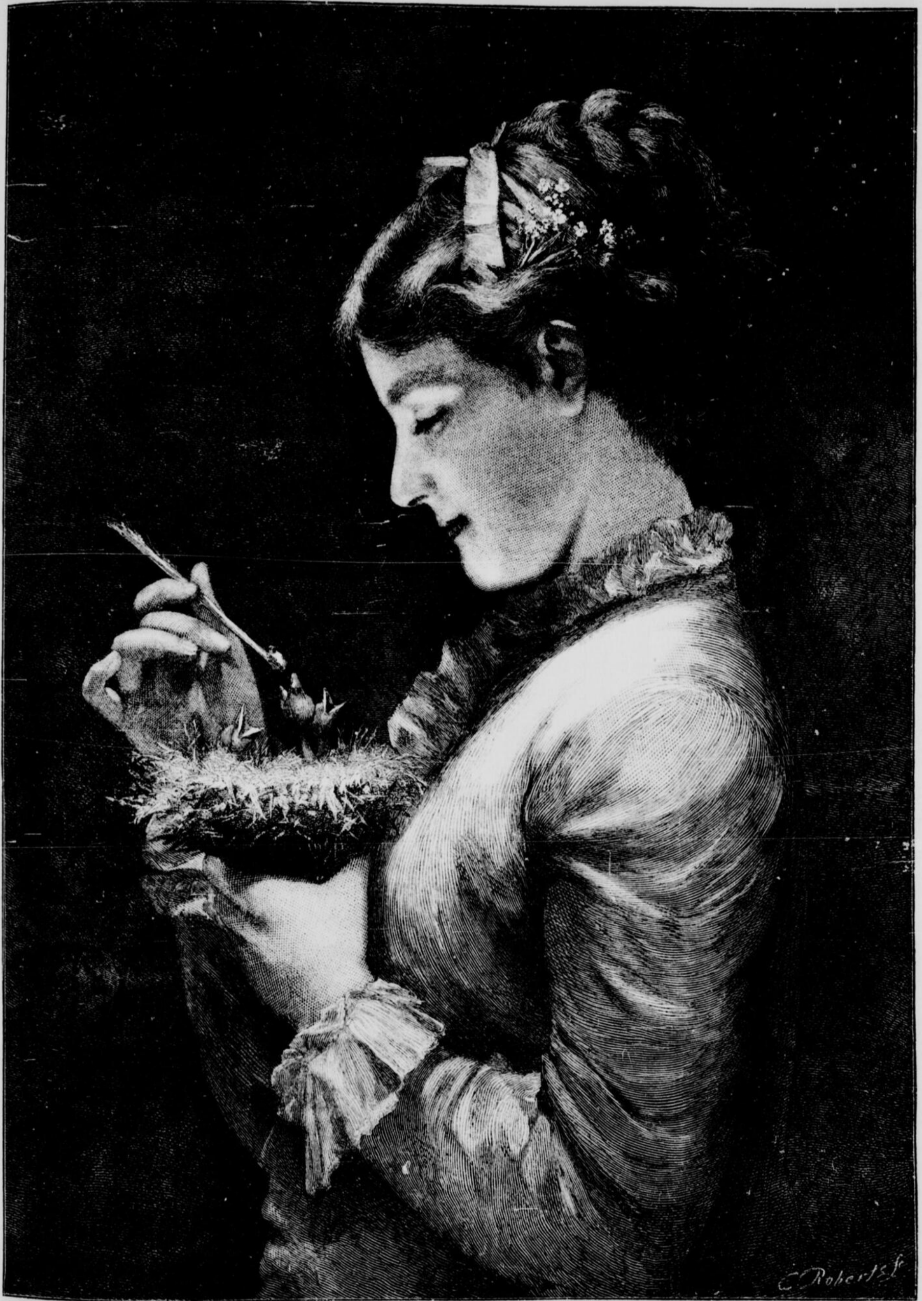
LA SECONDE MÈRE — TABLEAU DE L. VERDYEN