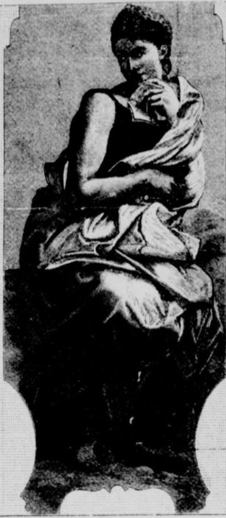
ERATO (La Poésie)