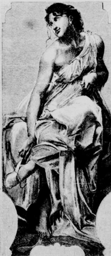
TERPSICHORE (La Danse)