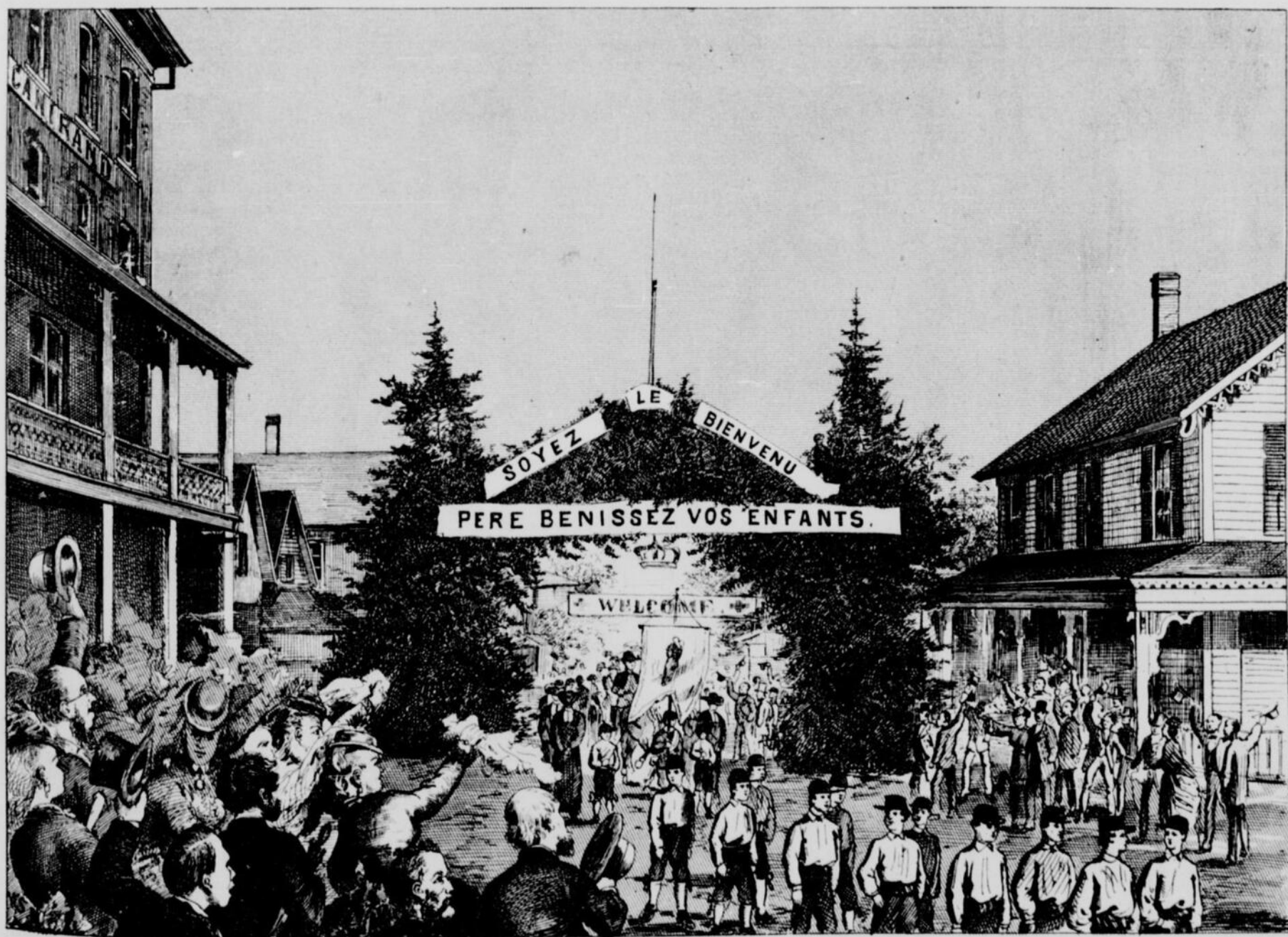
ENTRÉE DE MGR. RACINE A SHERBROOKE.—D'APRÈS UNE PHOTOGRAPHIE DE BLANCHARD, DE SHERBROOKE