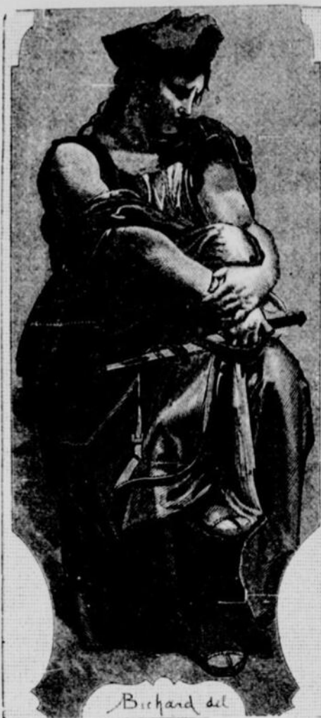
MELPOMENE (La Tragédie)