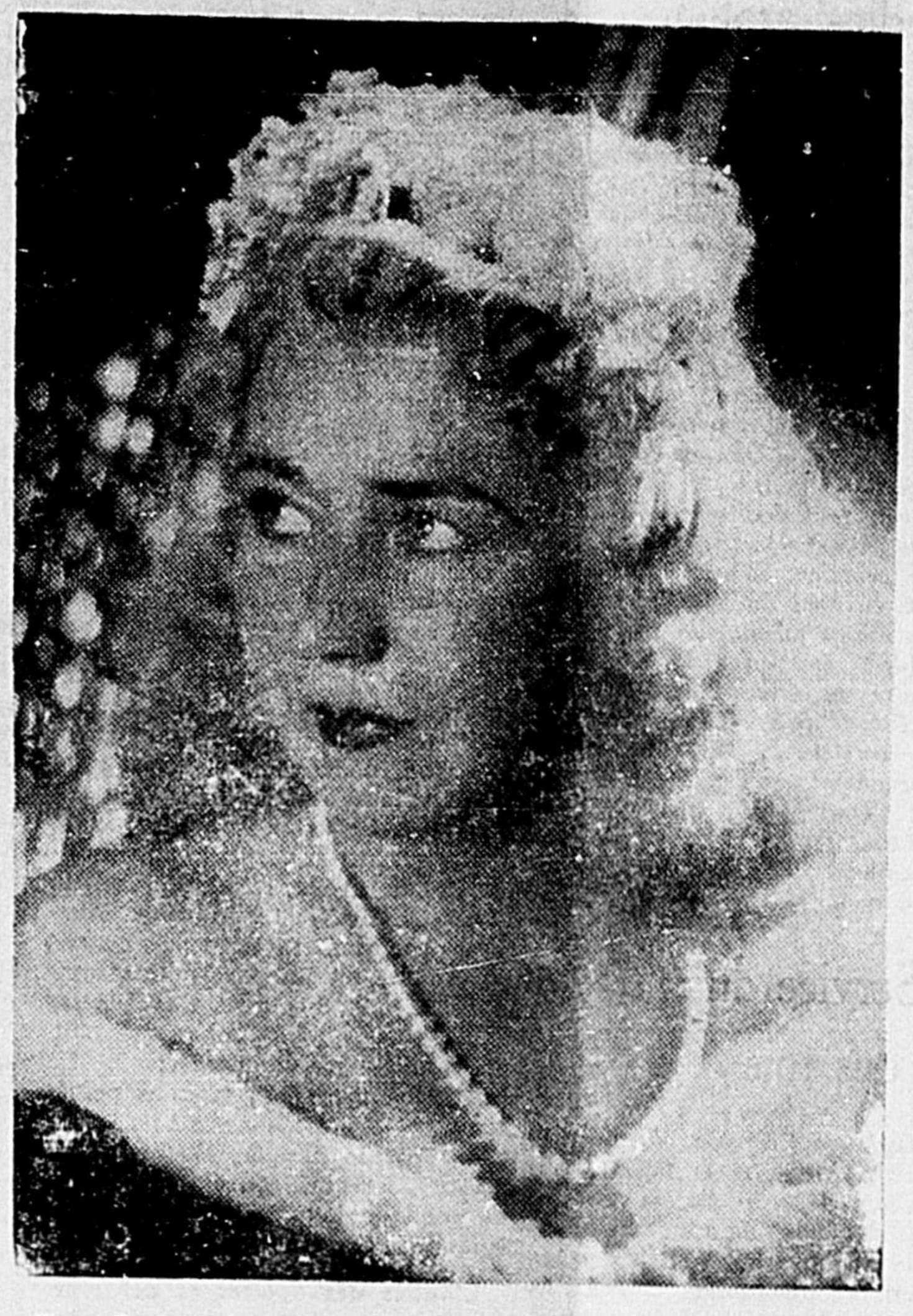
Erna Sack, soprano-coloratura de réputation mondiale, qui donnera un récital jeudi, 10 mars, à la salle académique du Séminaire de Saint-Hyacinthe, sous les auspices de la Ligue Antituberculeuse.