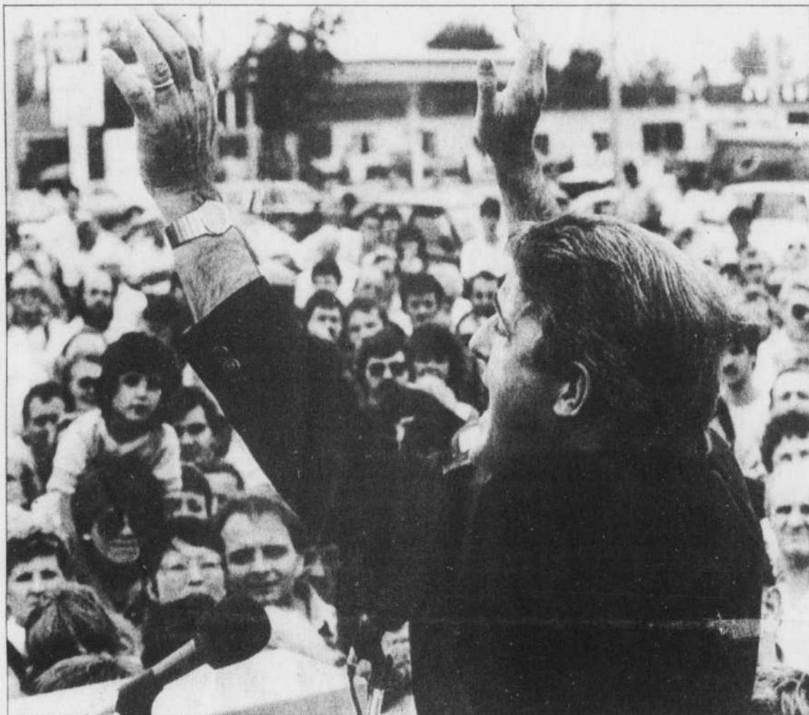
L'air triomphant, Brian Mulroney salue des deux bras la foule dense qui s'est assemblée pour le rencontrer hier à St-Hyacinthe. Dans la région, même les candidats conservateurs ont été surpris des succès de foule de leur chef.

Le discours économique de M. Mulroney est surtout concentré sur le thème de la création d'emplois. Voir page 10: Mulromanie