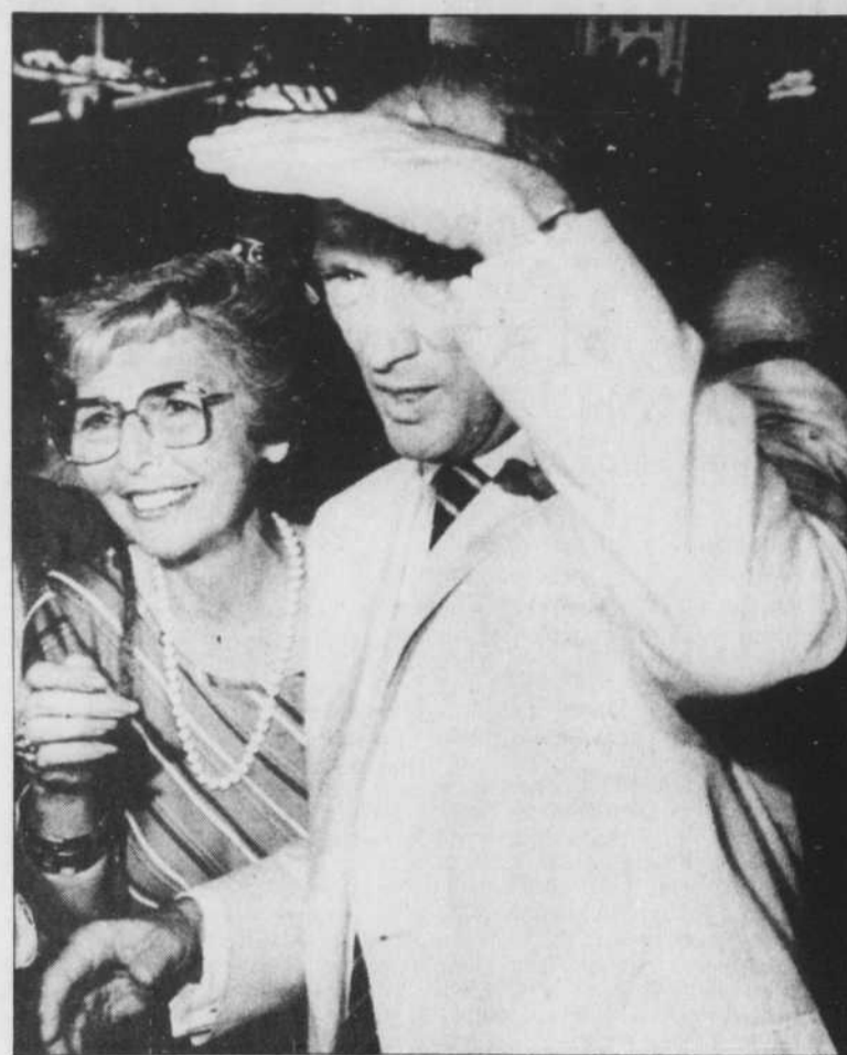
Aveuglé par les réflecteurs de la télévision et ralenti dans son mouvement par la foule qui s'est massée pour le voir, l'ancien premier ministre Pierre Trudeau déambule dans les couloirs d'un centre commercial de la banlieue ouest de Montréal, en compagnie de la candidate libérale Sheila Finestone, qui aspire à sa succession comme députée de la circonscription de Mont-Royal.

Au cours d'un débat radiodiffusé sur les ondes de CJMS l'opposant au député conservateur de Joliette Roch LaSalle, le ministre du Développement économique régional, M. André Ouellet, a défendu le fait qu'il vivait à Ottawa. « Je crois qu'il est normal qu'un père de famille, soit-il en politique ou dans d'autres domaines, puisse aller retrouver sa femme le soir et déjeuner le matin avec ses enfants. »