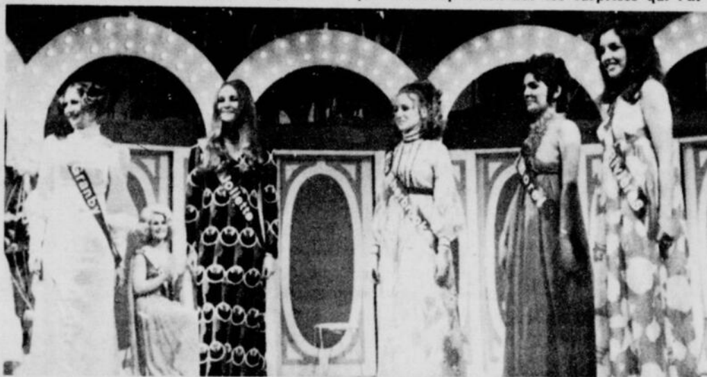
Cinq jolies candidates finalistes attendaient anxieusement le verdict du jury l'an dernier. Cette année, les candidates sont plus nombreuses que jamais et la grande finale se déroulera le 29 mai.