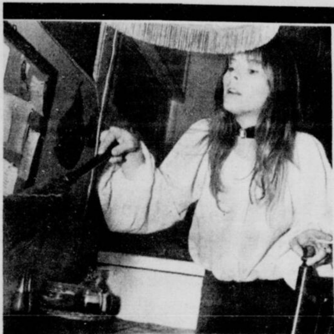
Casanière, elle ne quitte son home que pour des raisons professionnelles et on ne la voit que rarement dans les cocktails.