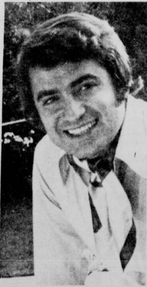
MICHEL LOUVAIN ... une vraie carrière!