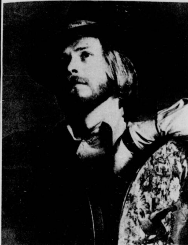
Everything Stops for Tea..... JOHN BALDRY (Warner Bros. 2614)

Jamais, je crois, un chanteur n'a démontré, sur un même album, autant de versatilité que John Baldry sur "Everything Stops for Tea". Aussi, pour pouvoir mieux apprécier ce disque il faudra d'abord être très ouvert musicalement parlant, car, de la variété, il y en a ça je vous jure! En fait, cet album contient autant de styles de musiques différents que de chansons... De "Everything Stops for Tea", une pièce dans la tradition des meilleures comédies musicales britanniques, à "Iko, Iko", une sorte de folklore haïtien, on a droit à du rock, du blues, du country, du funky-rock... Mais toujours, Baldry s'y débrouille, dans chacun de ces rythmes dissemblants, tel un grand comédien qui change naturellement et aisément de personnage. Elton John, Rod Stewart, Klaus Voorman viennent ici lui assurer une excellente collaboration. A écouter absolument.