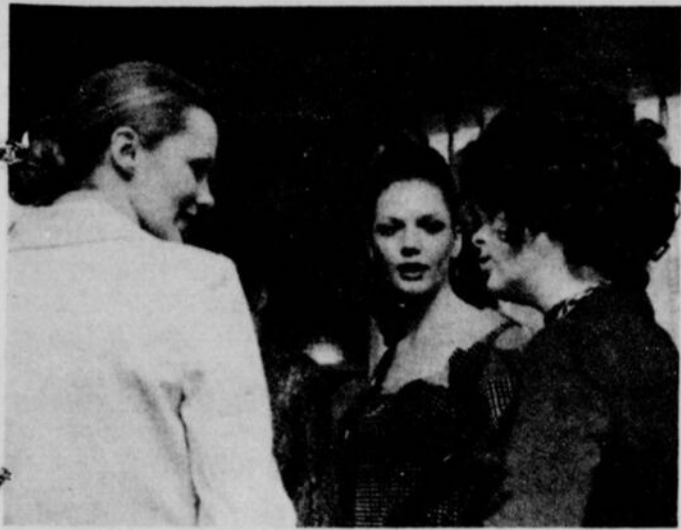
Une panoplie de jolis mannequins étaient sur les lieux, dont la plupart étaient ou les élèves ou les professeurs de Mme Watier.