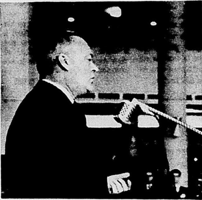
1960 est déjà loin...

Plus ça change, plus c'est pareil. Feu Maurice Duplessis nous avait habitué à une forme personnelle, anti-sociale et arbitraire de gouvernement. Lui parlait-on d'assurance-maladie, il répliquait que la meilleure assurance contre la maladie, c'est encore la santé...; réclamait-on la gratuité scolaire au niveau universitaire, il statuait que de toute façon le terrain de stationnement est trop petit à l'Université de Montréal... En