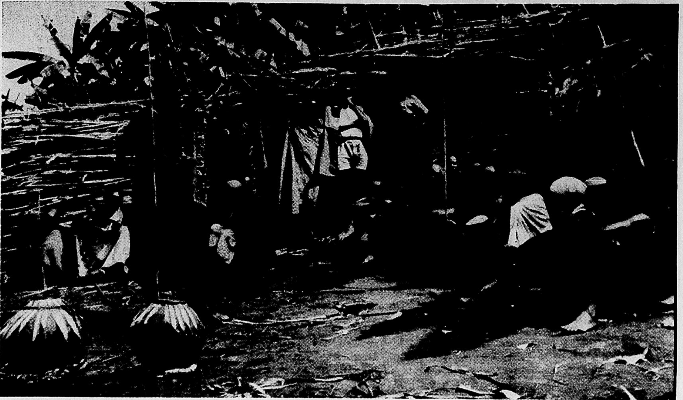
« Nous nous étions rendus à cette conférence avec nos préjugés d'hommes blancs... »

africains. Et surtout, ne tient-on pas suffisamment compte de ce que ce phénomène date à peine de 1960, à une échelle aussi grande. Considérant le chemin parcouru en si peu de temps, n'y a-t-il pas beaucoup à espérer ?