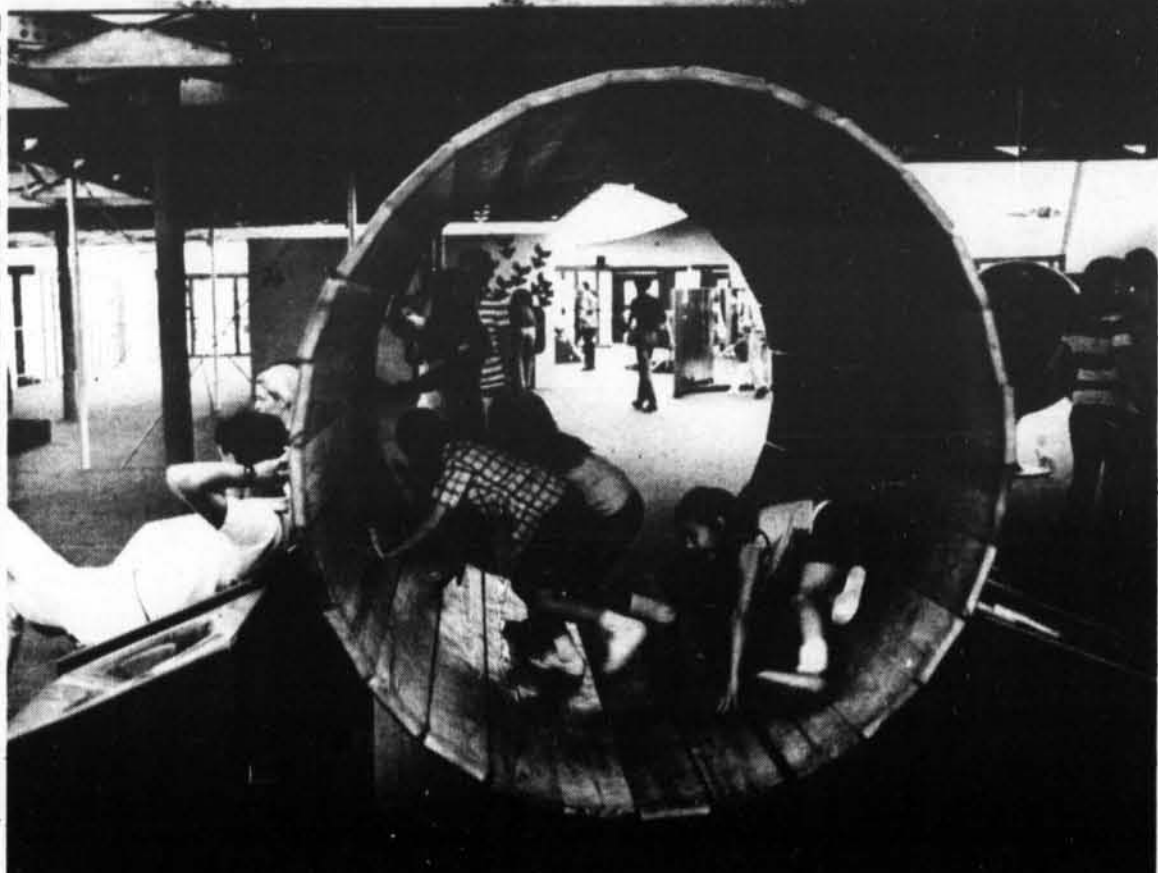
Ce n'est pas "en roulant ma boule, en roulant" comme dans la chanson, mais bien "en roulant mon baril, en roulant"; et la popularité de ce nouveau jeu au pavillon des Enfants, à Terre des Hommes, est immense, comme on peut le constater d'après la photo.