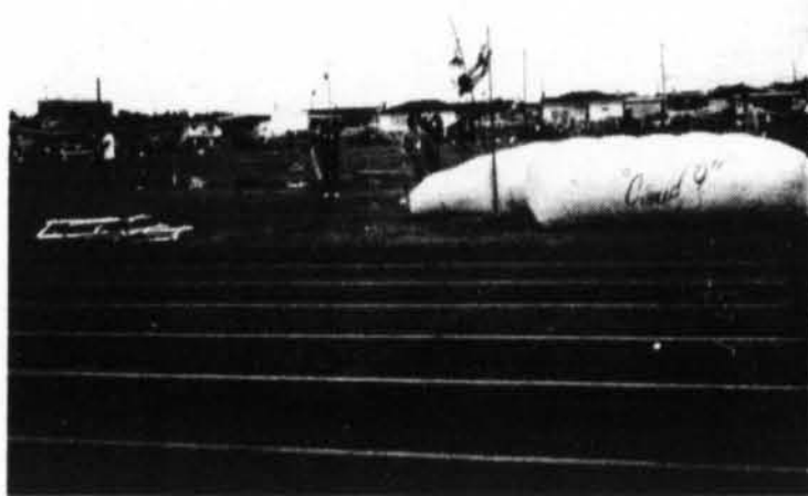
Le jeune athlète Alain Gravelle dans le saut à la perche, bon pour une mention honorable.

Entre-temps, nous profitons de l'occasion pour présenter nos meilleurs souhaits à tous et chacun.