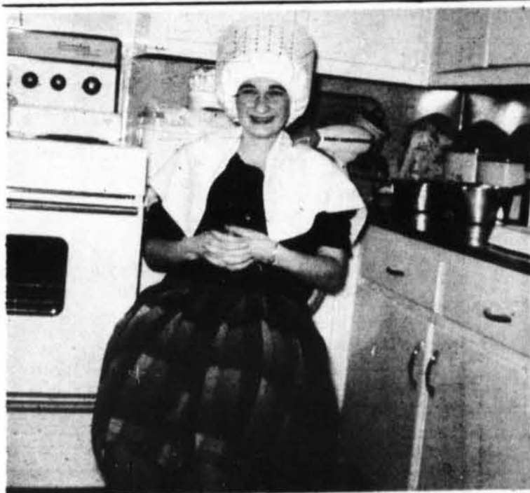
La reconnaissez-vous. On a plus les coiffeuses qu'on avait.

Chénéville remporte les honneurs de la série 2 de 3 de St-André-Avellin - Chénéville. Ces derniers attendent les gagnants de la série Ripon - Papineauville.