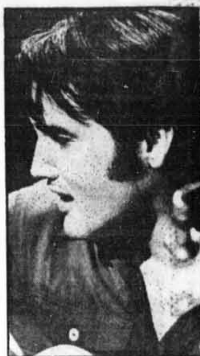
Le jeune Elvis Presley