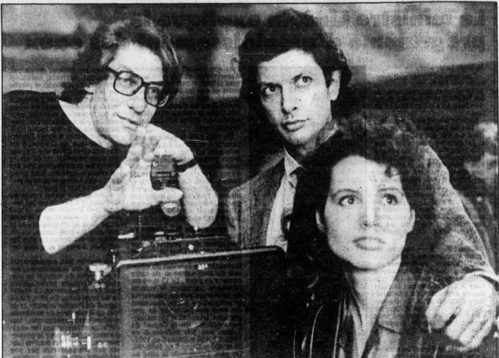
David Cronenberg dirigeant Jeff Goldblum et Geena Davis pendant le tournage de «The Fly».