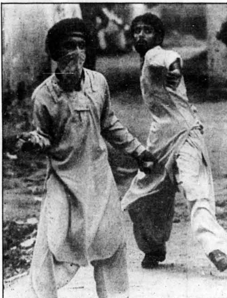
Deux partisans de l'opposition au régime militaro-civil du Pakistan armés de pierres photographiés hier dans le centre de Karachi lors des affrontements avec la police.