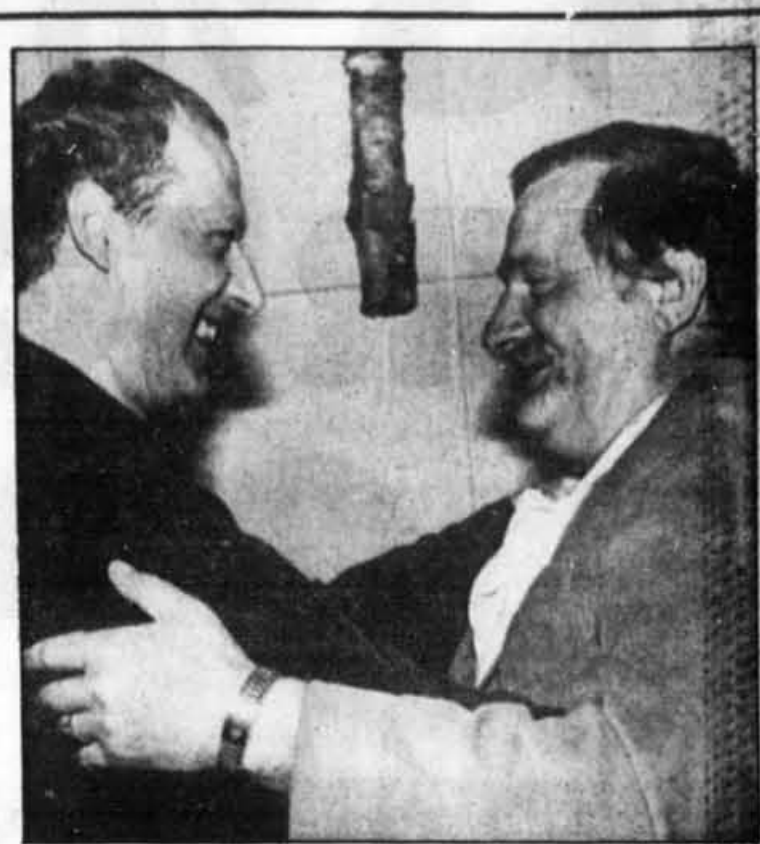
Lech Walesa (à droite) et Adam Michnik.