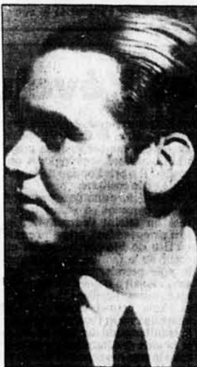
Federico Garcia Lorca

Il n'est guère de semaines en effet où ne soient livrés à un public avide des textes inédits du poète, jusqu'ici gardés par la famille, des lettres inconnues, des dessins oubliés - sans parler des anecdotes nouvelles sur une vie qui ne cesse d'étonner - rendant ainsi impossible, pour le moment, une édition des oeuvres vraiment complètes de Lorca.