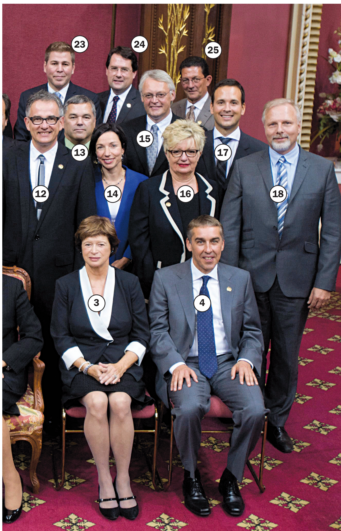
JACQUES BOISSINOT LA PRESSE CANADIENNE