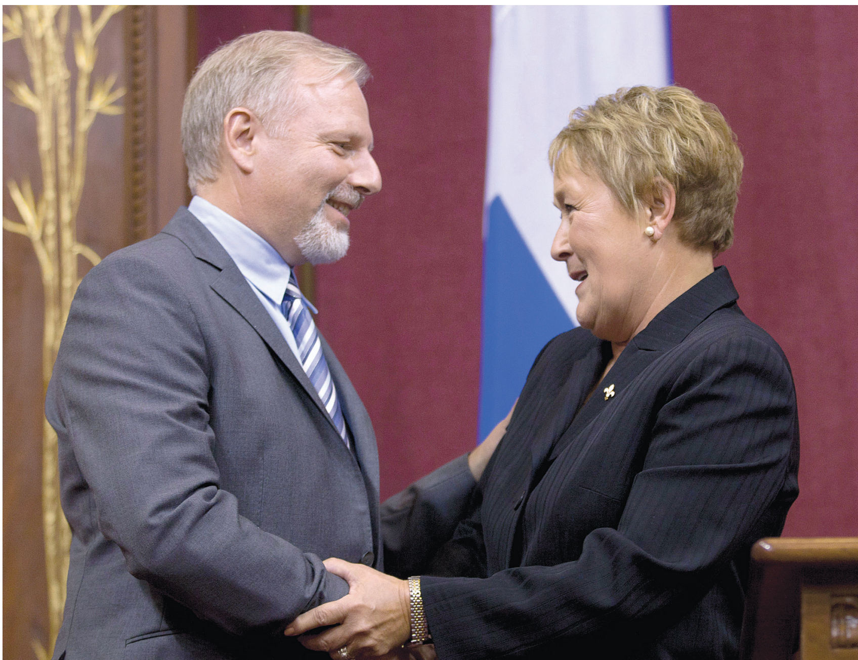
Pauline Marois accueille Jean-François Lisée, ministre des Relations internationales, du Commerce et de la Francophonie et responsable de la région de Montréal.

■ L'économie entre les mains d'un seul homme ■ La parité hommes-femmes n'est pas atteinte ■ Les verts sont au pouvoir