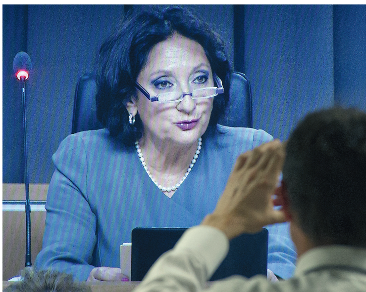
La juge France Charbonneau