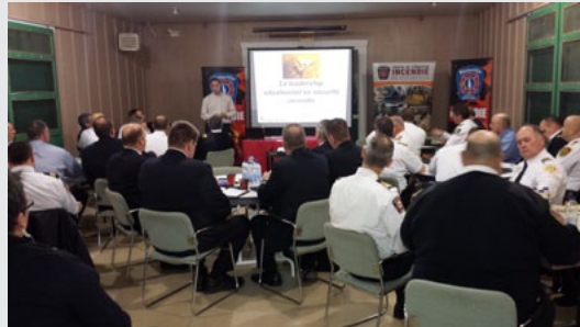
Une quarantaine de personnes ont participé à la conférence du 26 novembre dernier