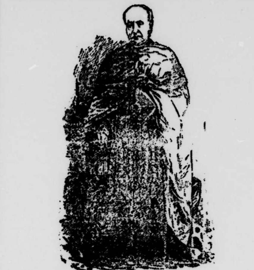
SON EXCELLENCE LE CARDINAL TARDIF

Mécontent à ceux qui tentent d'arrêter le flot venant.