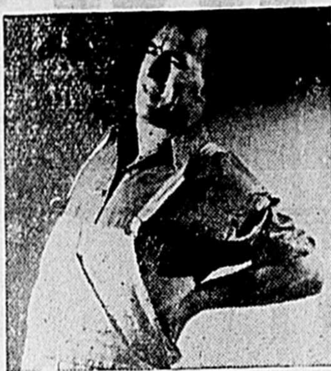
Obtenez un Prompt Soulagement!