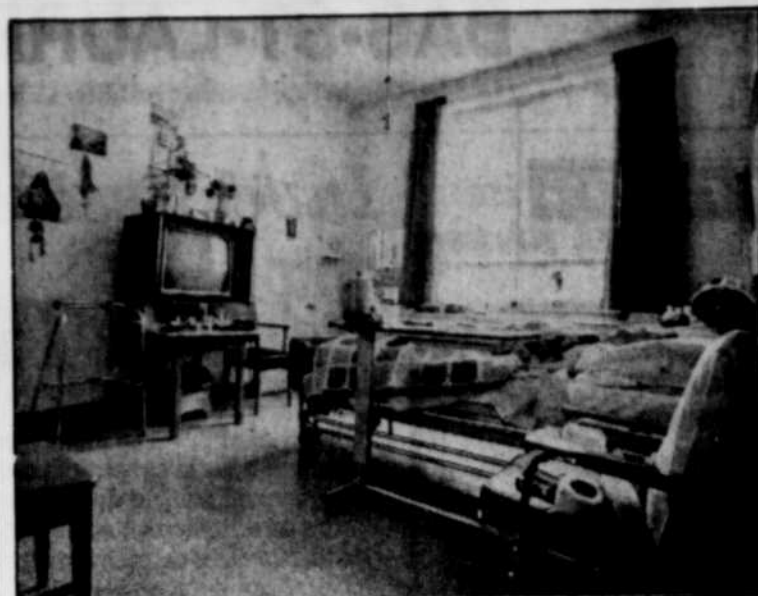
La maison d'hébergement accueille les malades et offre un soutien aux familles qui les entourent.