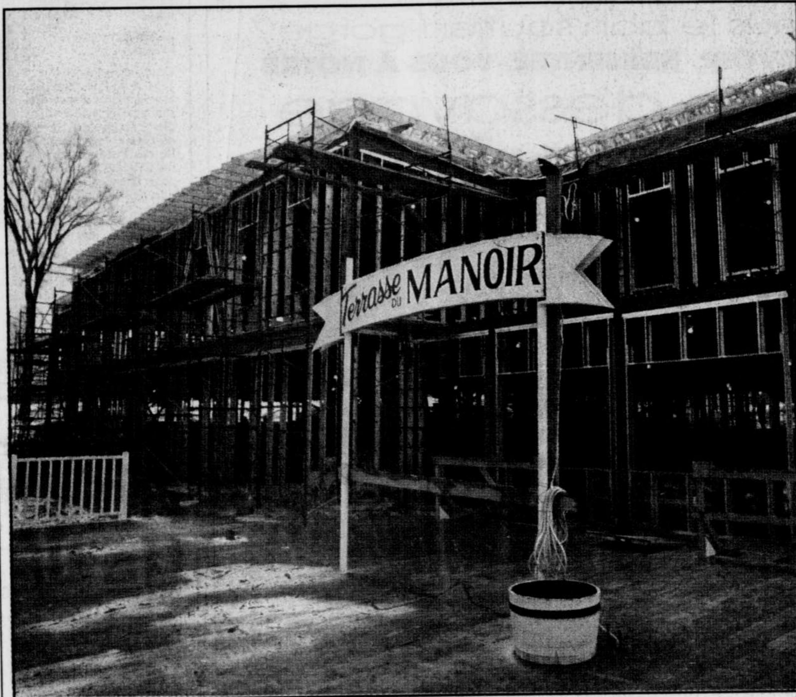
Au premier palier, un restaurant de 150 places sera aménagé ainsi qu'une terrasse extérieure de 150 places surplombant la chute et remplaçant celle qui fut aménagée temporairement l'été dernier.