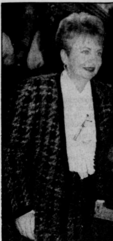
La ministre de la Santé et des Services sociaux, Lucienne Robillard, a annoncé cette semaine des coupes de 200 millions $ touchant l'ensemble du réseau. La part prévue pour la région de Québec est de 22 millions pour l'année budgétaire en cours.

QUÉBEC — Pas moins de 361 propositions de réduction de dépenses dans la santé et les services sociaux ont été soumises au cours des dernières semaines par 13 comités formés par la Régie régionale de la santé de Québec. Ces comités ont le mandat de revoir l'ensemble de ces dépenses dans la région.