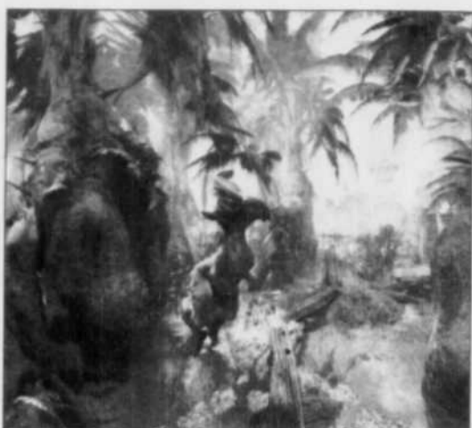
On croise parfois des êtres pour le moins bizarres...