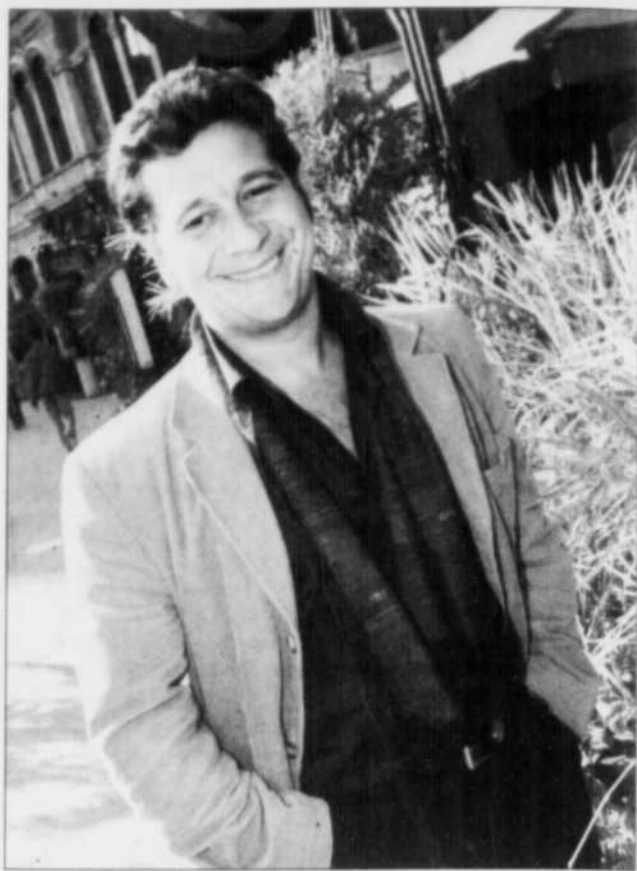
Le venin de Laurent Gerra n'épargne personne.

Sans cette tribune qui lui permet de dire tout haut ce que plusieurs pensent tout bas, difficile d'imaginer ce que serait devenu Laurent Gerra. « En tout cas, je n'aurais pas animé Tout le monde en parle ! »