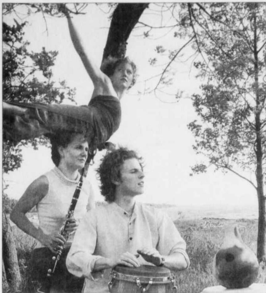
Le groupe Triodas est en spectacle ce soir à la salle François-Prévost du Centre des Migrations de Montmagny. Des créations de musiques du monde et contemporaine en fusion avec de la danse actuelle et théâtrale. Rés.: 1-866-641-5799.