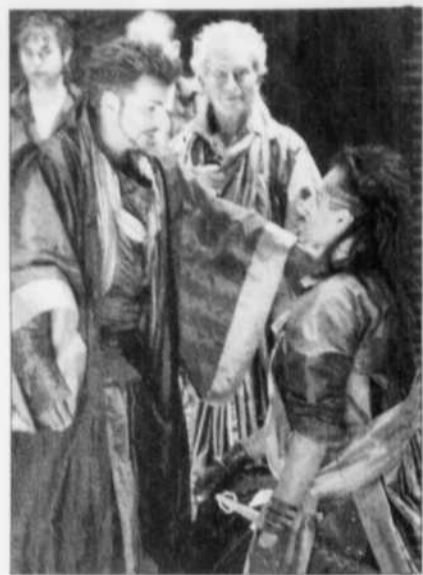
Une scène de « Cid »