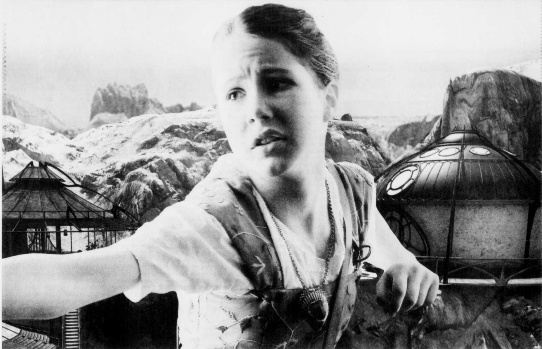
Le personnage Yeesha devant un paysage de l'Âge de Tomahna.