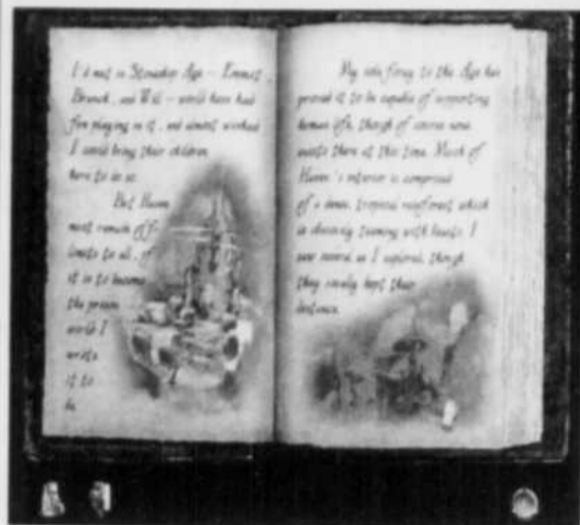
Les livres fournissent souvent la clef des énigmes.