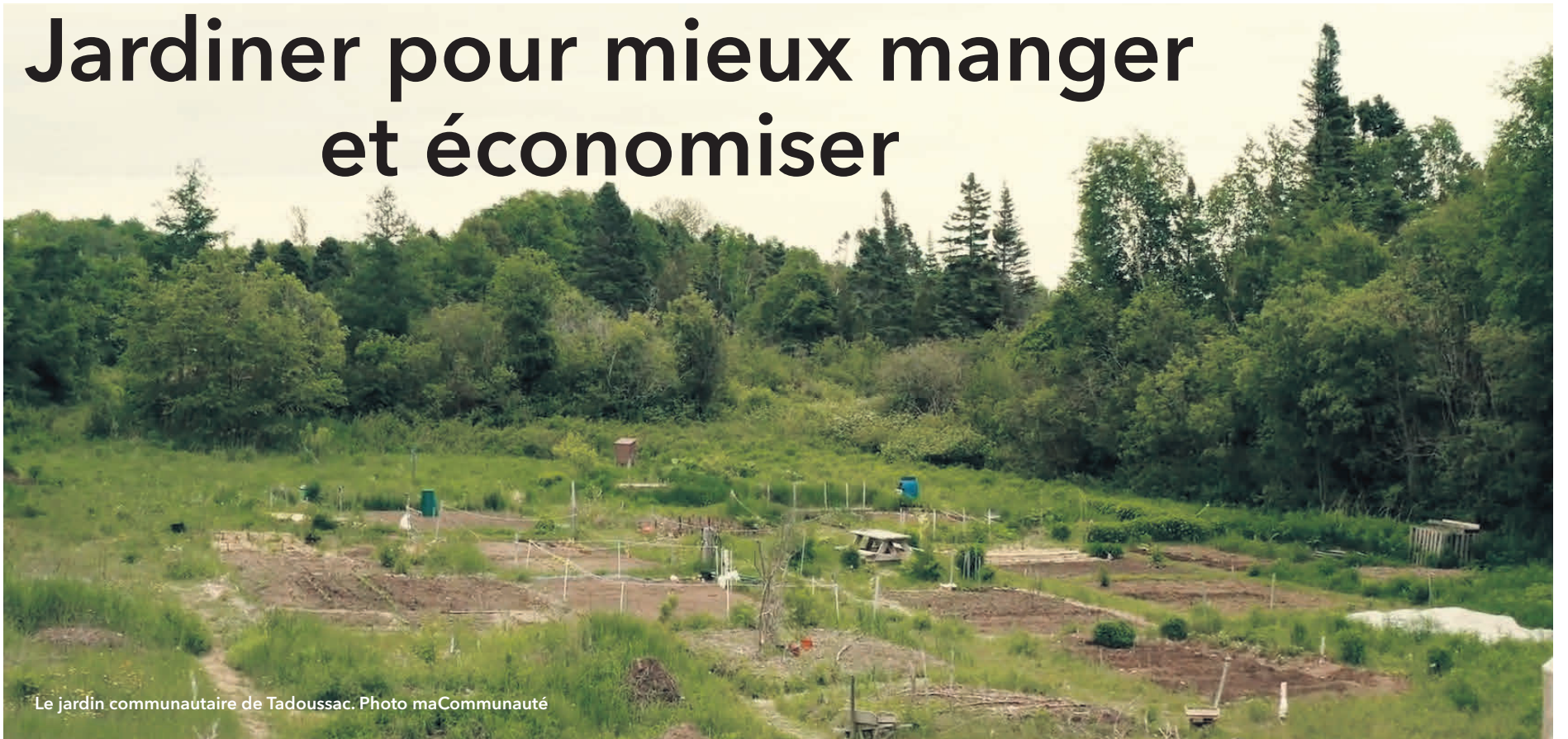
Le jardin communautaire de Tadoussac.

Forestville a reçu une aide financière de 18 216 $ de la MRC de la Haute-Côte-Nord pour l'implantation d'un jardin communautaire dans la municipalité. Avec son implantation, la plupart des municipalités de la région auront leur propre jardin communautaire.