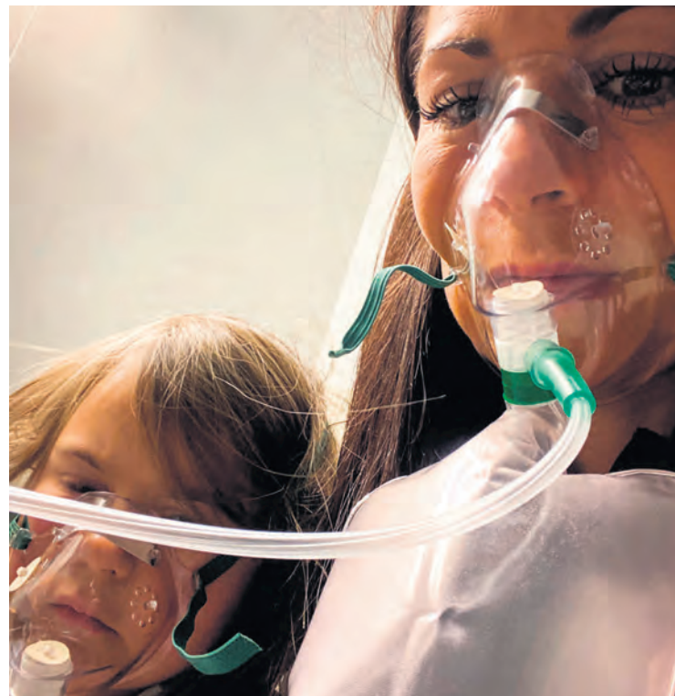
La famille a rapidement été placée sous oxygène, puisque les tests sanguins démontraient la présence de monoxyde de carbone dans leur sang.

« Comme nous sommes sortis rapidement, nous avons pu éviter une tragédie », dit-elle.