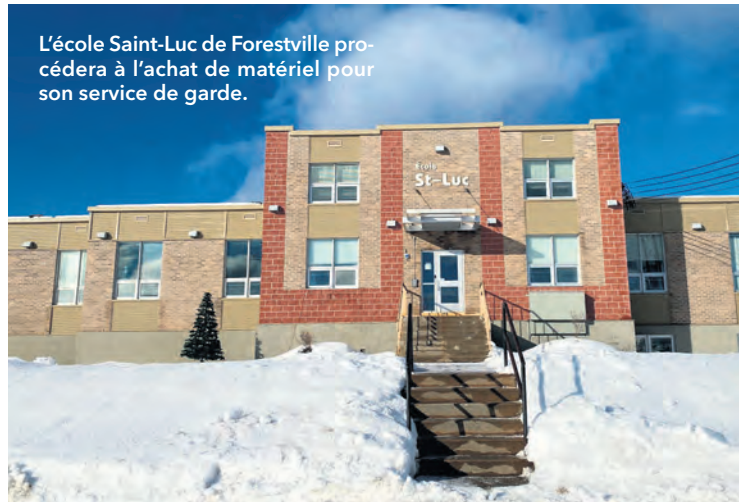
L'école Saint-Luc de Forestville procédera à l'achat de matériel pour son service de garde.

L'école Saint-Luc bénéficiera d'une aide financière dans le cadre de la politique de soutien aux projets structurants (PSPS) de la MRC de La Haute-Côte-Nord. L'école primaire de Forestville pourra procéder à l'achat de matériel afin de bonifier le fonctionnement du service de garde.