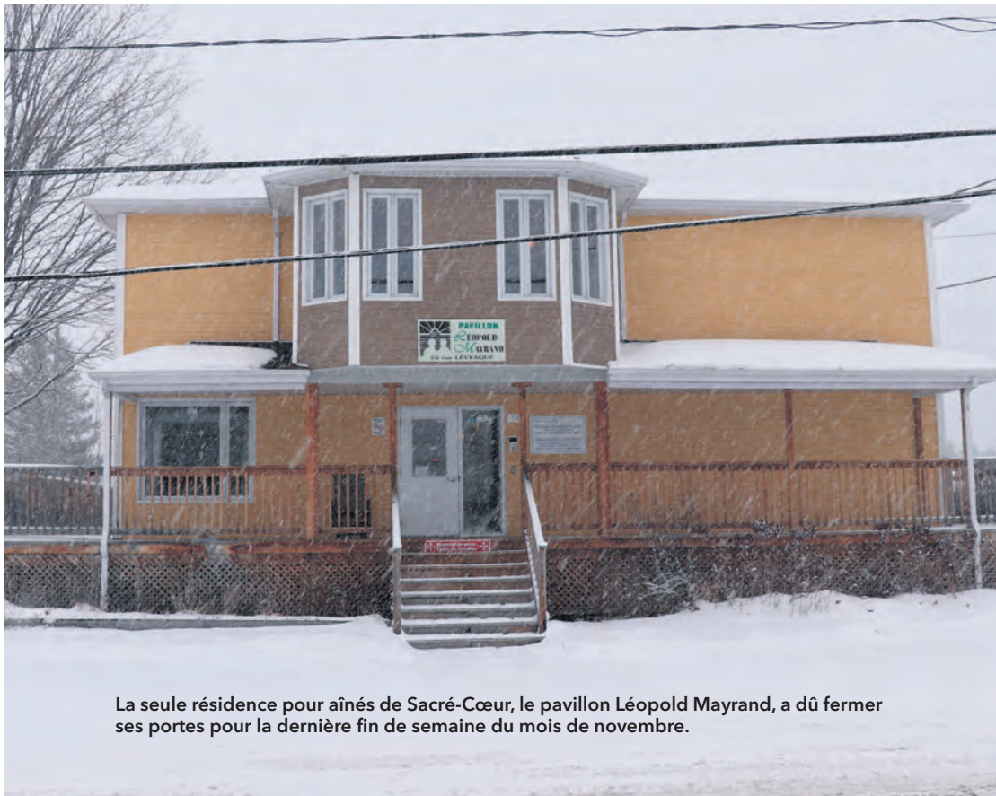
La seule résidence pour aînés de Sacré-Cœur, le pavillon Léopold Mayrand, a dû fermer ses portes pour la dernière fin de semaine du mois de novembre.

« La raison qu'ils ont évoquée était qu'on ne répondait pas aux exigences de conformité des règles de salubrité et d'offres que l'on donnait à nos résidents. Le CISSS nous a ensuite retiré notre permis d'opération ».