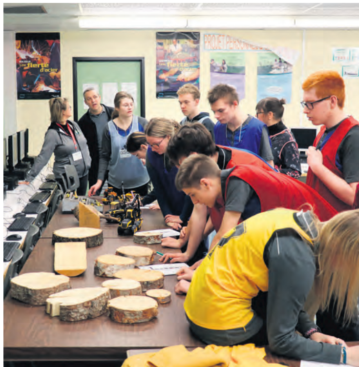
Des participants à l'atelier de découverte d'intérêts professionnels.

« J'ai réussi à améliorer ma concentration, à mieux dormir et à être plus performante quand j'étudiais. J'ai aussi découvert des métiers que je ne connaissais même pas », souligne-t-elle.