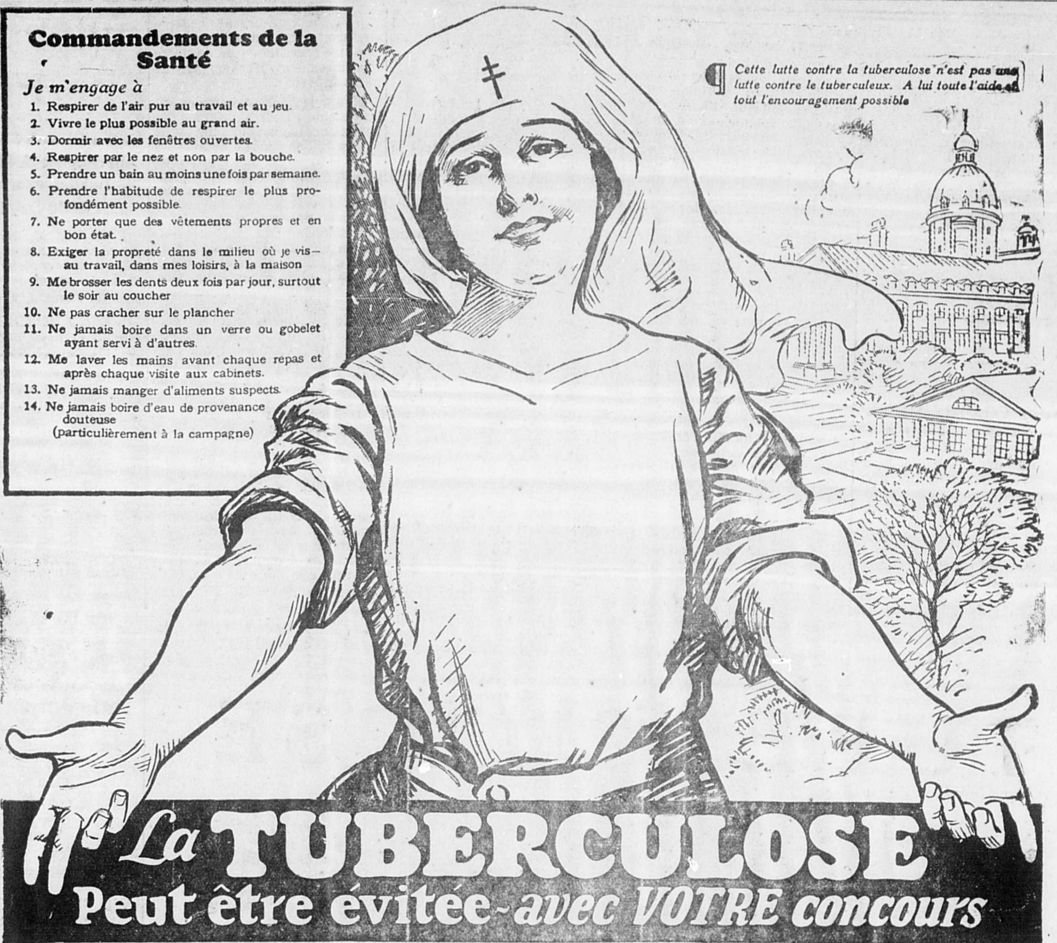
Cette lutte contre la tuberculose n'est pas une lutte contre le tuberculeux. A lui toute l'aide et tout l'encouragement possible.

CHAQUE citoyen doit coopérer à la campagne contre la Tuberculose et la Mortalité Infantile. Hommes, femmes, enfants, chacun doit faire sa part.