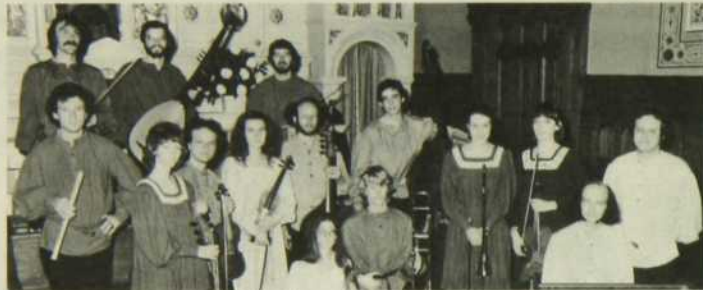
Studio de musique ancienne de Montréal

Victor Hugo, à connaître ou à redécouvrir, dans le cadre d' Actuelles , du 8 au 12 et du 15 au 19 avril à 18h30, au réseau FM de Radio-Canada.