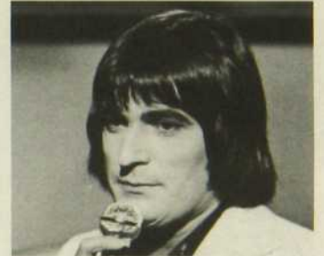
Serge Lama aux Beaux Dimanches

Mauvais garçons et mauvaises filles à Trouvez l'erreur