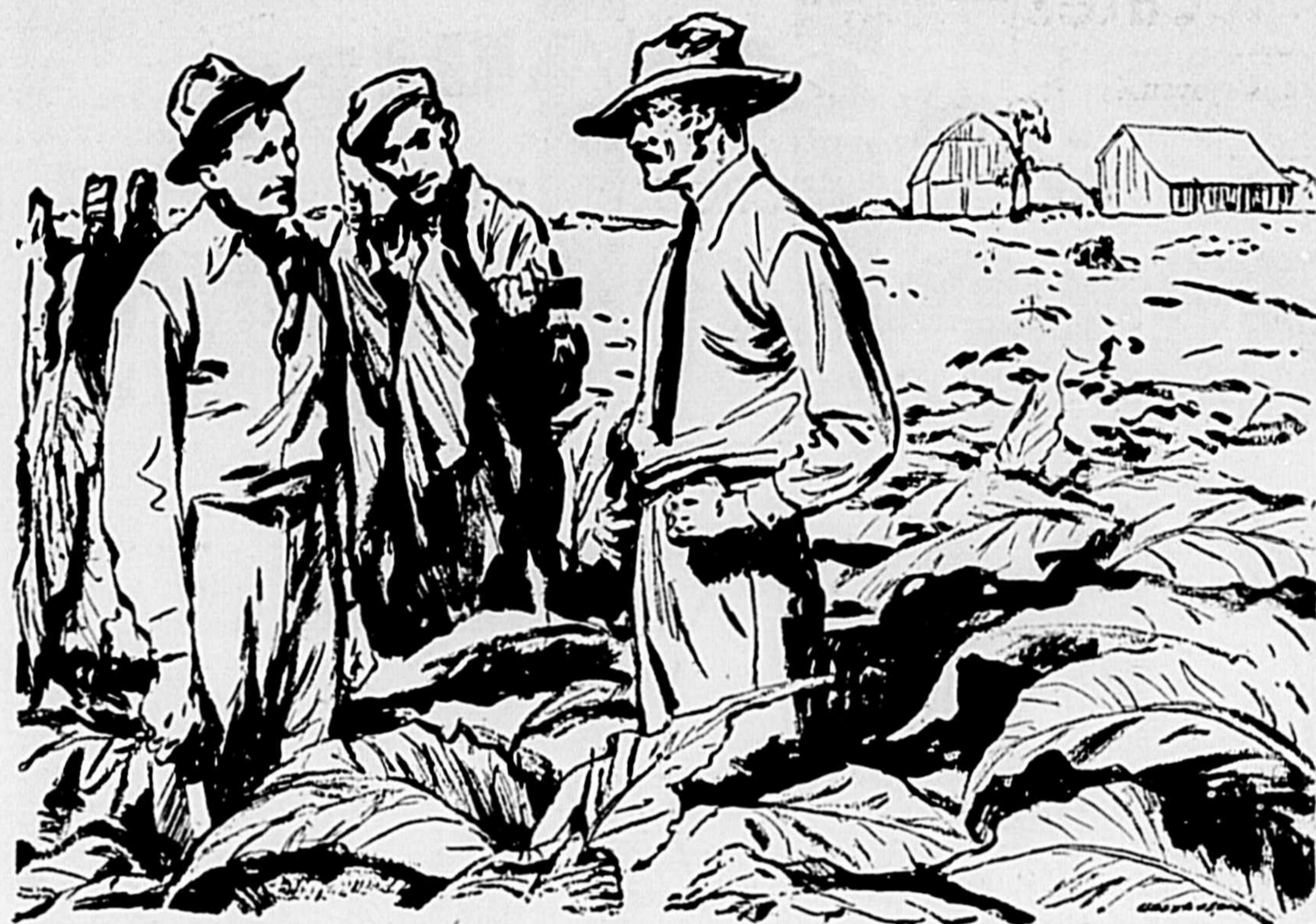
LES CANADIENS ET LEURS INDUSTRIES — ET LEUR BANQUE