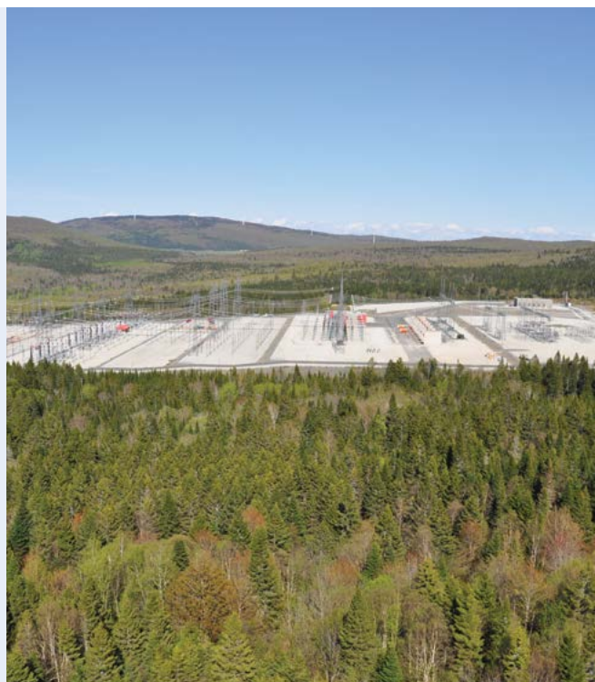
Poste des Appalaches, à Saint-Adrien-d'Irlande

This publication is also available in English.