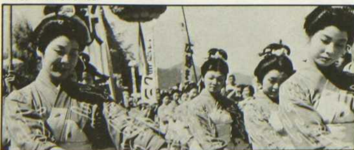
«Hiroshima mon amour»