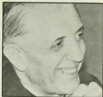
Le cardinal Léon-Joseph Suenens

On ne saurait imaginer «carrière» ecclésiastique plus «réussie», réputation et avenir mieux assurés, jusqu'au jour où, en 1969, il publie dans les Informations catholiques