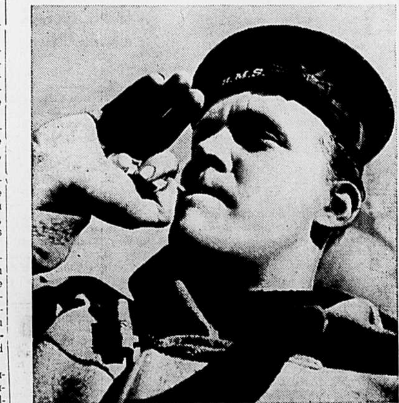
Le travail obscur mais héroïque des équipages des dragueurs de mines britanniques est d'une importance vitale à la sécurité des ports et des voies maritimes. Sur cette photo, un officier-marinier à bord d'un dragueur de mines attire l'attention de ses hommes à l'aide d'un traditionnel sifflet.