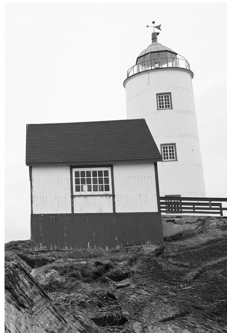
YAN DOUBLET LE DEVOIR

Pour vos questions, bonnes adresses, découvertes, trucs, envies, bons et mauvais souvenirs de voyage : lkiefer@ledevoir.com . Pour mon blogue: ledevoir.com/liokiefer .