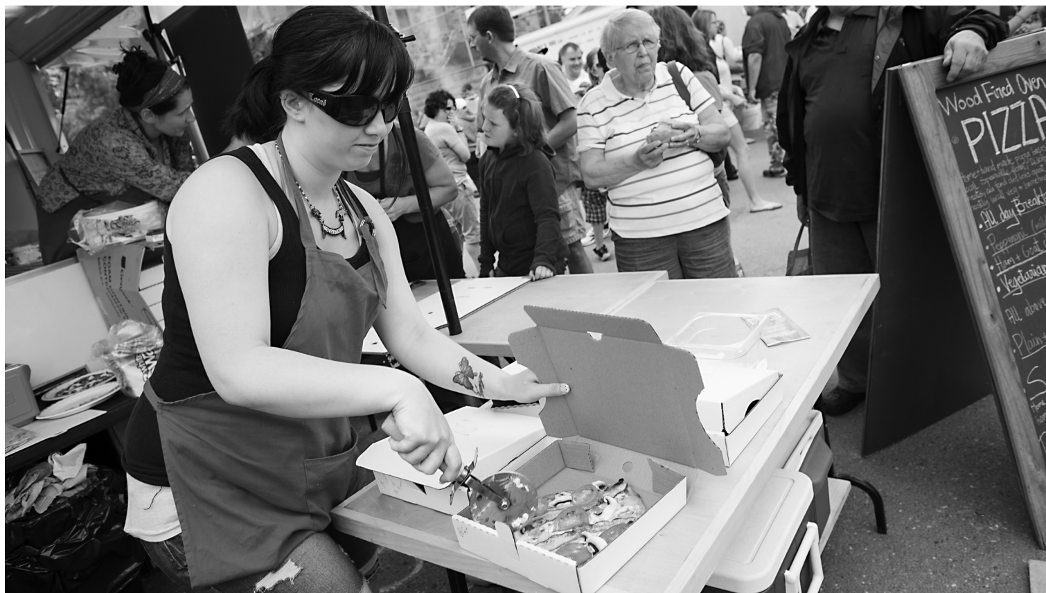
Au marché des fermiers de Fredericton, on trouve du homard, mais aussi de la pizza.

10 000 sudokus inédits de 4 niveaux de difficulté par notre expert Fabien Savary En exclusivité sur le site des Mordus www.les-mordus.com