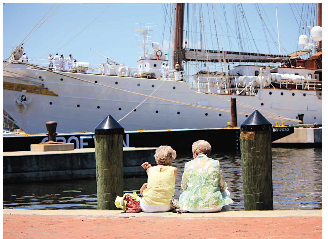
Femmes et marins se reluquent sur le bord de la rivière Elizabeth.

Norfolk est la ville maritime par excellence et accueille des bateaux de partout dans le monde