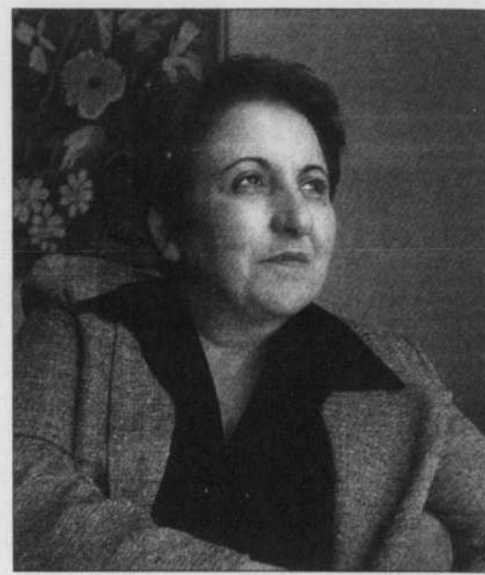
Pour l'Iranienne Shirin Ebadi, Prix Nobel de la paix, «les femmes doivent lutter contre la culture patriarcale, non contre la religion.»

Les musulmans qui s'efforcent dans leurs propres sociétés de changer les choses de l'intérieur y parviendront difficilement si, ailleurs dans le monde, l'islam est réduit à l'islamisme, et les musulmans, tenus