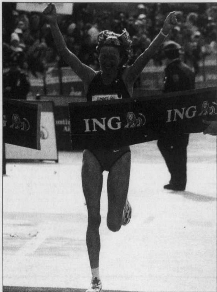
Jelena Prokopcuka, de la Lettonie, a remporté hier le marathon de New York pour la deuxième année consécutive.