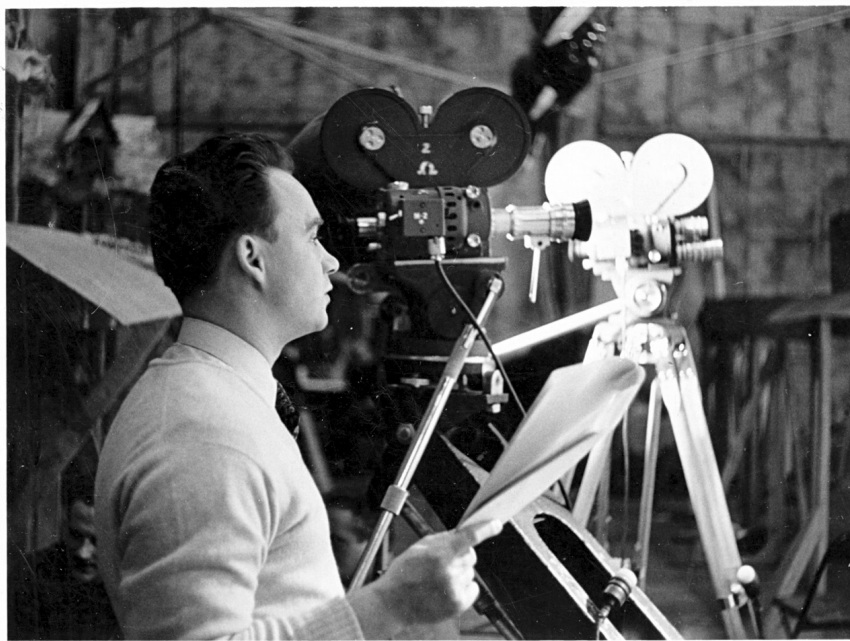
Pierre Gauvreau, script à la main, devant les caméras du téléroman Radisson, diffusé à la télévision d'État en 1957-1958.

Pour tout dire, c'est grâce à Claude et Pierre Gauvreau que j'ai découvert ce qu'on appelle l'écriture et la peinture modernes. À fréquenter l'un et l'autre, c'est ma propre vision des choses, de la philosophie et du monde qui changea. Et cela je le compris parfaitement quand,