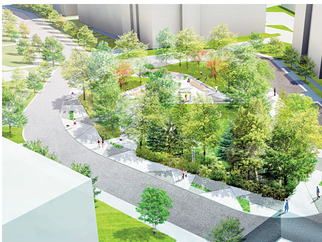
Vue aérienne du parc de Place de l'Acadie.

«La première étape du concours consistait à présenter une équipe et à exprimer des intentions, explique