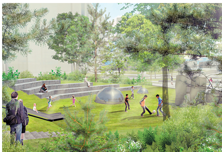
Une aire de jeu à la topographie ludique.