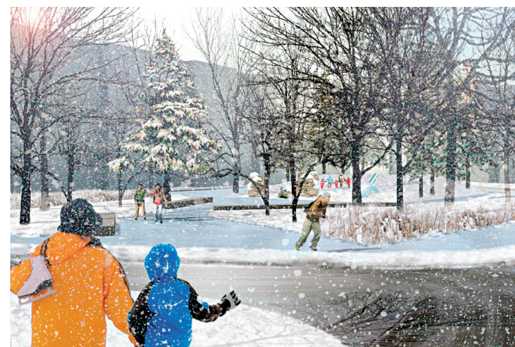
L'ambiance hivernale avec sa patinoire.

Le premier élément fort du projet est sa topographie «plan-