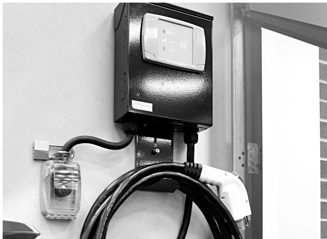
Une borne qui pourrait servir à recharger les batteries des véhicules électriques.

La batterie de ministres présents au lancement du Plan d'action 2011-2020 a vanté l'électrification d'une partie du parcours du futur Train de l'Est,